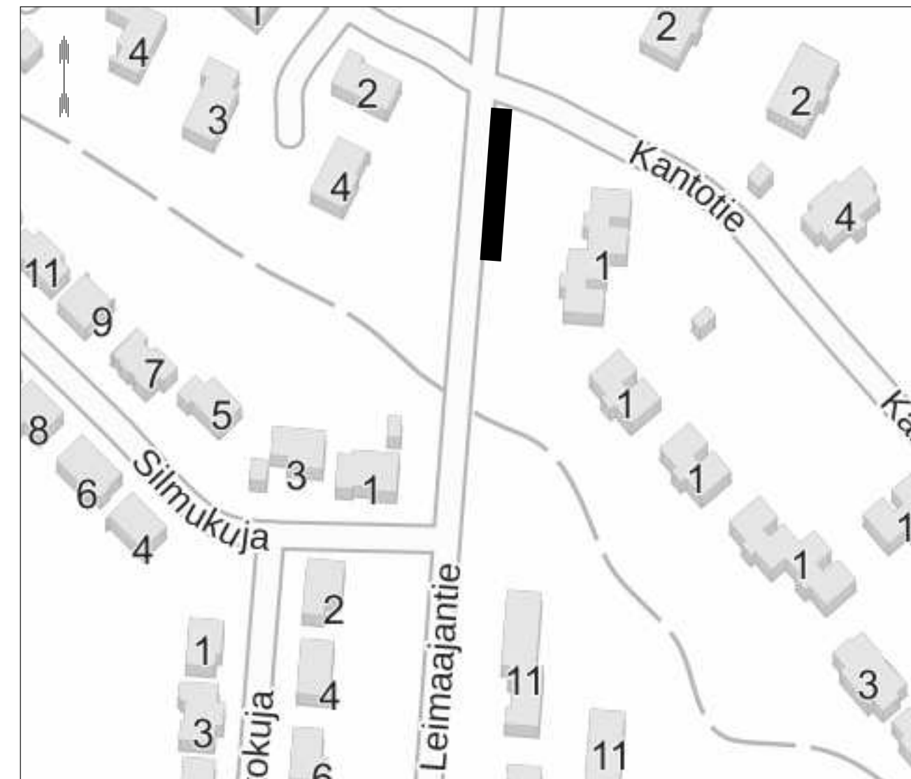
Suunnitelma-aineisto © Kuopion kaupunki 2024

KORKEUSJÄRJESTELMÄ N2000 KOORDINAATTIJÄRJESTELMÄ ETRS-GK27