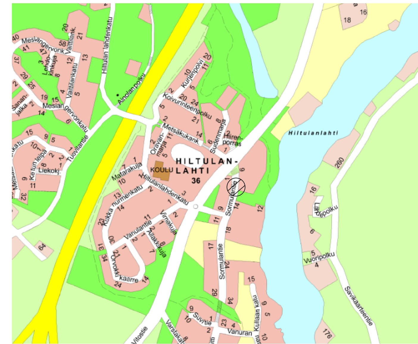
Suunnitelma-aineisto © Kuopion kaupunki 2024

KORKEUSJÄRJESTELMÄ N2000 KOORDINAATTIJÄRJESTELMÄ ETRS-GK27