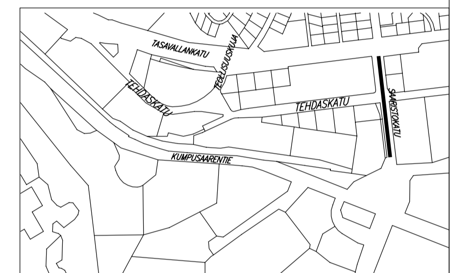
Suunnitelma-aineisto © Kuopion kaupunki 2023