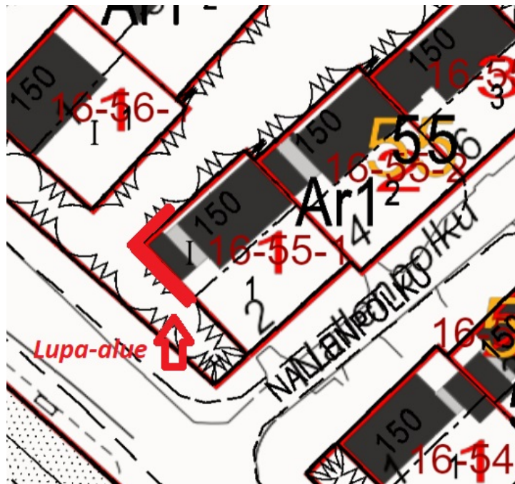
Nallenpolku 2, yleisille alueille tulevat pysyvät rakenteet

Asiaa on käsitelty yleisten alueiden työryhmässä 1.8.2024. Rakenteista ei aiheudu haittaa kunnossapidolle, joten asiassa sovelletaan kaupunkirakennelautakunnan 26.2.2020 § 59 hyväksymän hinnaston (taulukko 1, maksuluokka 1) mukaista maksua yleisille alueille tulevista pysyvistä rakenteista. Rakenteiden sijoittuminen on esitetty alla olevassa kartassa.