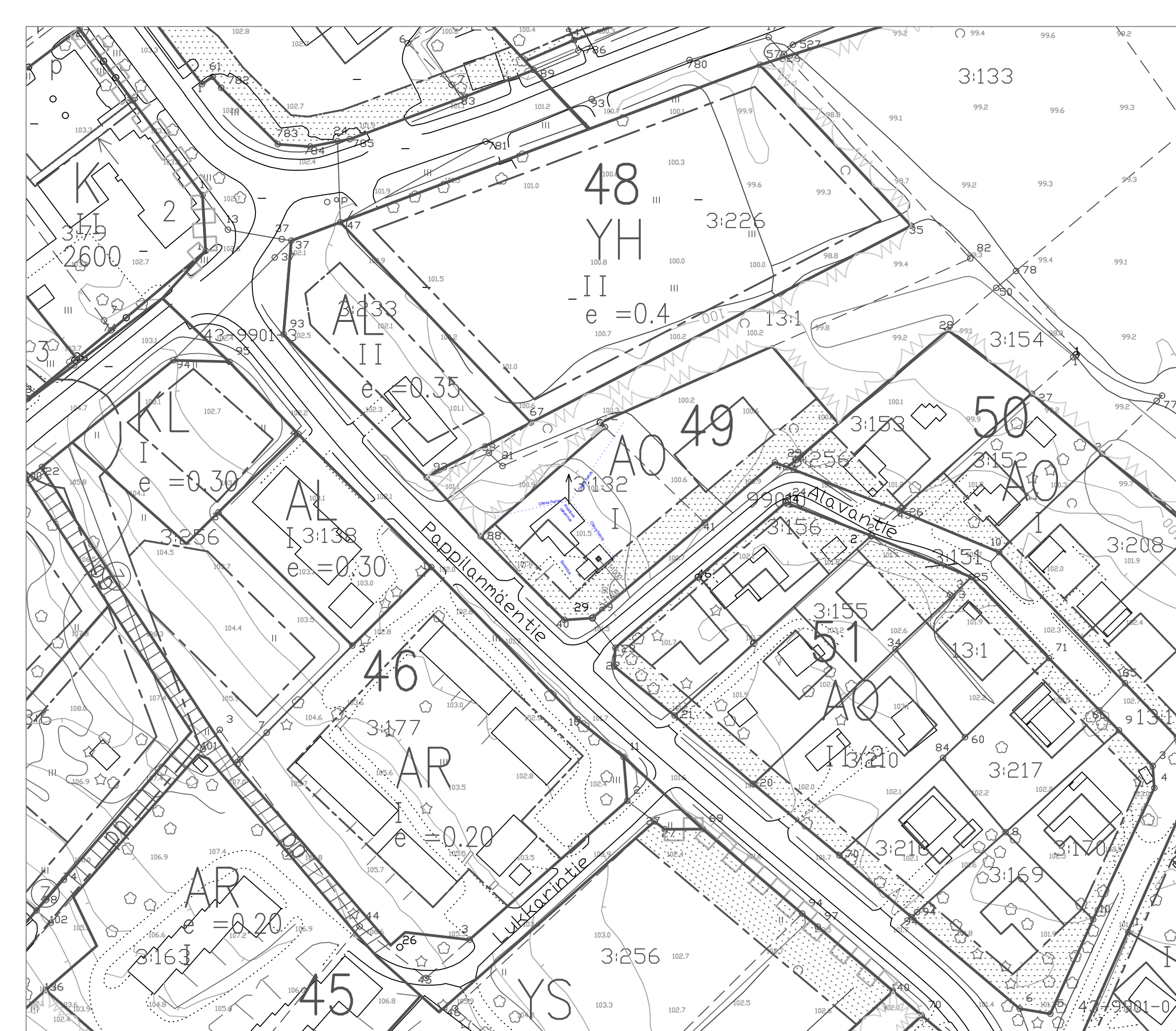
1:1000 / Asemapiirros / Kuopion kaupunki, numeerinen aineisto (kantakartta).