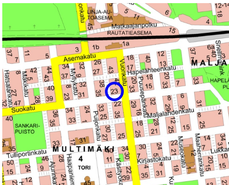
Tontin sijainti osoitettuna opaskartalla.