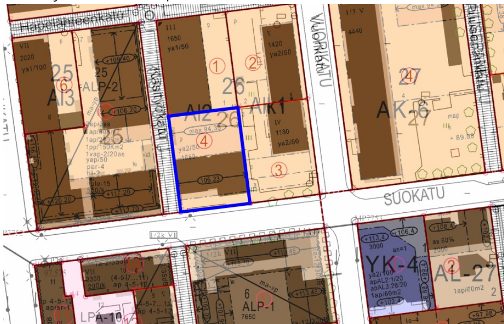
Tontin sijainti osoitettuna ajantasa-asemakaavan kartalla sinisellä rajauksella.

Tontilla on voimassa sisäasiainministeriön päätöksellä vuonna 1974 vahvistettu asemakaava. Tontti on voimassa olevassa asemakaavassa osoitettu liikerakennusten korttelialueeksi (asemakaavamerkintä Al2). Rakennusoikeutta on tontille osoitettu 1 650 k-m 2 . Asemakaavamerkinnän mukaan sallitusta kerrosalasta saa enintään 20 % käyttää asuinhuoneistoiksi.