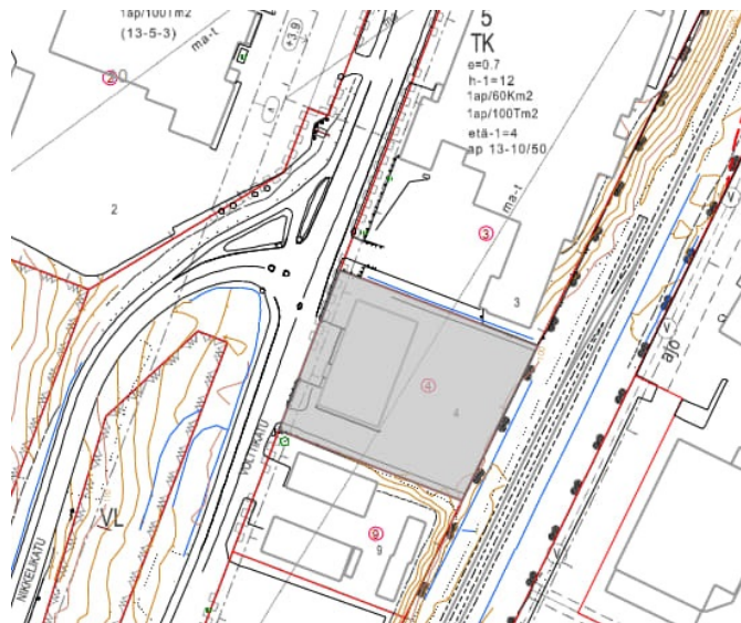
Tontin sijainti ajantasa-asemakaavan kartalla.

Tontin vuokralaisen kanssa on neuvoteltu vuokrasopimuksen uusimisesta sekä tontin hulevesiongelmasta. Neuvotteluissa päädyttiin ratkaisuun, että kaupunki suunnittelee ja toteuttaa Valttikadulle rakenteita, jotka parantavat kadun hulevesien kulkeutumista hulevesiverkostoon. Tontin vuokraksi esitetään 20 128 euroa vuodessa sidottuna elinkustannusindeksin pistelukuun 2 338 (joulukuun 2025). Vuokran määrä perustuu ulkopuoliseen arviolausuntoon, vallitsevaan vuokratasoon sekä naapuritonttien vuokran määrään ja vuokrattavan tontin arvo edustaa käypää markkinavuokraa. Edellä mainittuun viitaten kaupunkirakennelautakunnalle esitetään, että tontin 297-13-5-4 maanvuokrasopimus uusitaan.