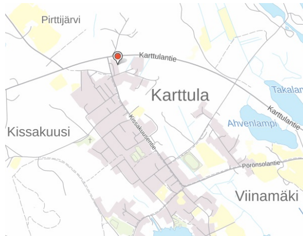
Vuokrattavan tontin sijainti opaskartalla.

Tontille on tarkoitus rakentaa sähkövarasto. Hankkeen tavoitteena on mahdollistaa teollisen sähkövaraston toteutus Karttulan teollisuusalueella. Suunnittelun aloituskokous on pidetty 1.4.2026. Forus Oy pyytää tontin vuokrausta Forus Oy:n tytäryhtiön Kuopio Akku Oy:n nimiin.