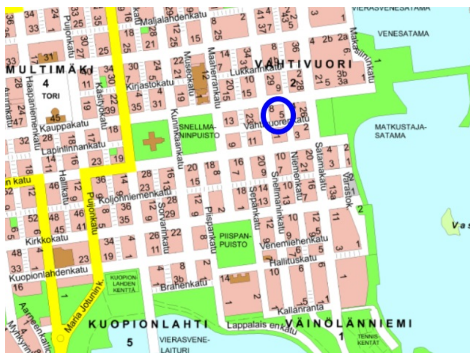
Tonttien sijainti osoitettuna opaskartalla.

Esisopimus koskee tontteja 297-2-29-5, 297-2-29-6 ja 297-2-29-7. Tonttien sijainti on osoitettu seuraavissa kartoissa.