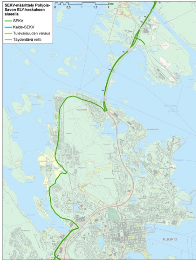
Kuva 3 SEKV-reitin määrittely Pohjois-Savossa Kuopion alueella vuoden 2017 selvityksessä