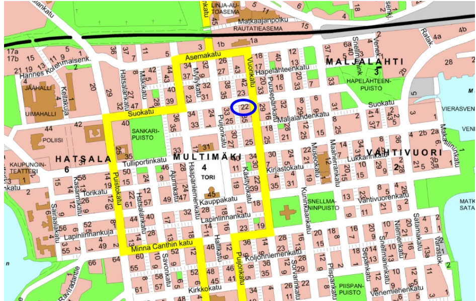
Tontin sijainti esitettyä opaskartalla.

Kuopion evankelis-luterilainen seurakuntayhtymä (jäljempänä selostustekstissä myös "maanomistaja") omistaa tontin 297-4-6-1, jolla sijaitsee seurakuntayhtymän omistama keskusseurakuntatalo. Tontin sijainti on esitetty oheisissa kartoissa.