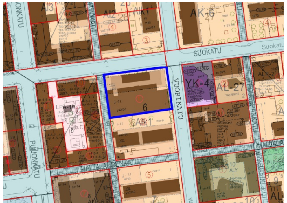
Tontin sijainti esitettyä ajantasa-asemakaavan kartalla.

Tontilla on voimassa sisäasiainministeriön päätöksellä vuonna 1974 vahvistettu asemakaava. Tontti on voimassa olevassa asemakaavassa osoitettu yhdistettyjen liike- ja asuntokerrostalojen korttelialueeksi (asemakaavamerkintä ALK1). Rakennusoikeutta on voimassa olevassa asemakaavassa tontille osoitettu 4,600 k-m 2 . Asemakaavamerkinnän mukaan sallitusta kerrosalasta saa enintään 20 % käyttää asuinhuoneistoiksi.