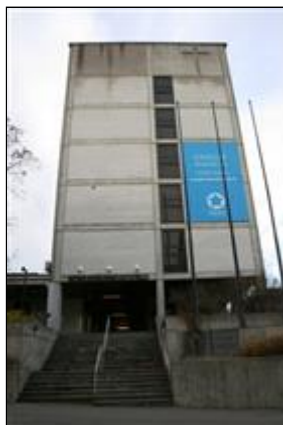
(Aada Mustonen 4.5.2015)

id: 300185 rakennustunnus: 102796767R rakennustyyppi: hallinto- ja toimistorakennukset alkup. käyttö: 342 seurakuntatalot nyk. käyttö: 342 seurakuntatalot