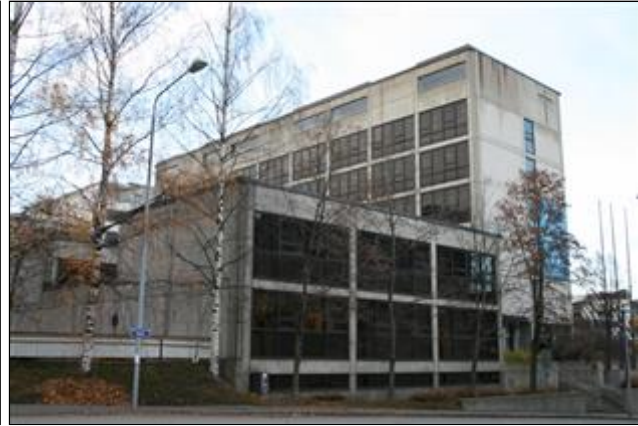
Keskuseurakuntatalon pohjoissivu ja itäpääty Suokadun ja Vuorikadun risteyksestä kuvattuna.