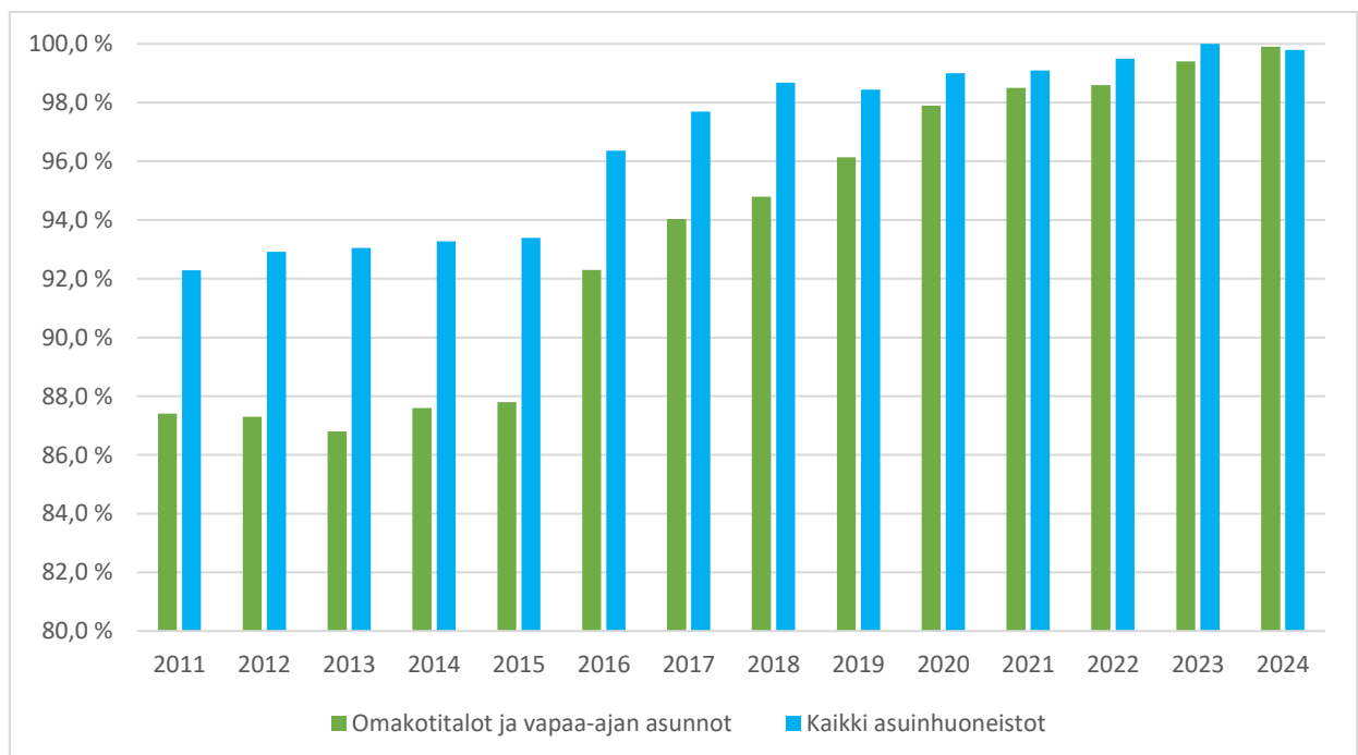
Kuva 2. Asuin- ja vapaa-ajan kiinteistöjen liittymisaste järjestettyyn jätehuoltoon (sekajäte)

Velvoite järjestää kiinteistölle sekajätteen jätehuolto koskee kaikkia asuin- ja vapaa-ajan kiinteistöjä. Liittymistä seurattiin vakiintuneesti tarkistamalla jätehuollon asiakasrekisteristä päättyneet asiakkuudet ja varmistamalla, että kiinteistöille järjestettiin jätehuolto uudelleen esim. omistajanmuutoksen jälkeen. Kaikista niistä kiinteistöistä, joita jätelain mukainen liittymisvelvoite järjestettyyn jätehuoltoon koskee, oli sekajätteen jätehuollon piirissä tilastojen mukaan lähes 100 % (jätehuoltoon liittyneiden rakennusten määrää on verrattu Tilastokeskuksen vuoden 2023 rakennustietoihin).