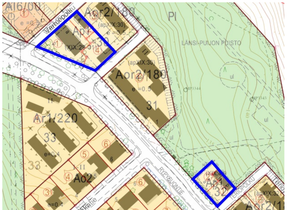
Kortteleiden 30 ja 32 autopaikkatonttien sijainnit kaupungin ajantasa-asemakaavan kartalla.

Rypysuon kaupunginosassa on aiemmin hinnoiteltu autopaikkatontteja Kuopion kaupunkirakennelautakuntakunnan päätöksellä 6.4.2022 § 57. Päätöksessä lautakunta vahvisti vuokran määrän kortteissa 17 ja 18 oleville autopaikkatontteille ja päätöksen mukaiset tonttien vuokrat ovat indeksitarkistettuina 0,68 e/m 2 /vuosi elinkustannusindeksin pisteluvun 2 316 (joulukuu 2023) tasossa. Myyntihintaa ei päätöksessä käsitelty. Kyseisten tonttien sijainti on esitetty seuraavissa kartoissa.