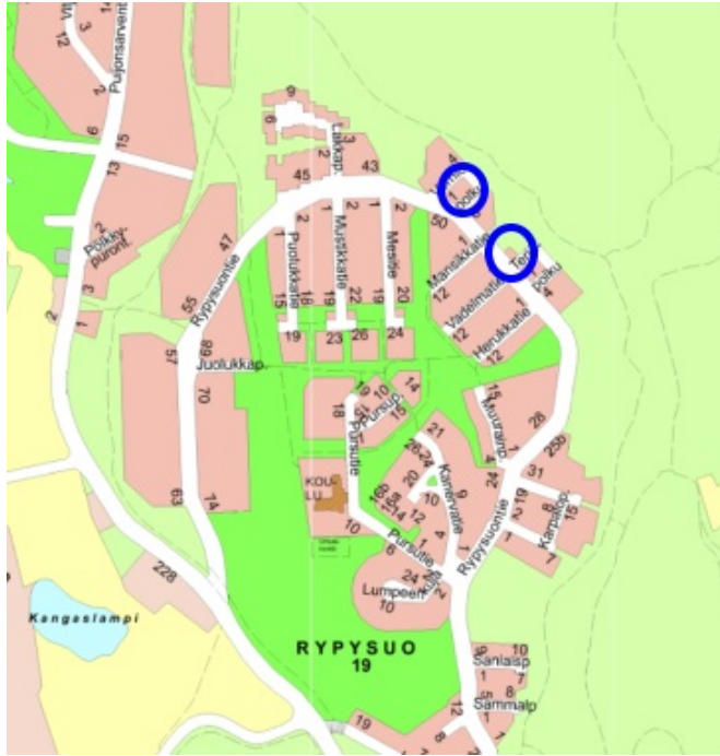
Kortteleiden 30 ja 32 autopaikkatonttien sijainti opaskartalla.