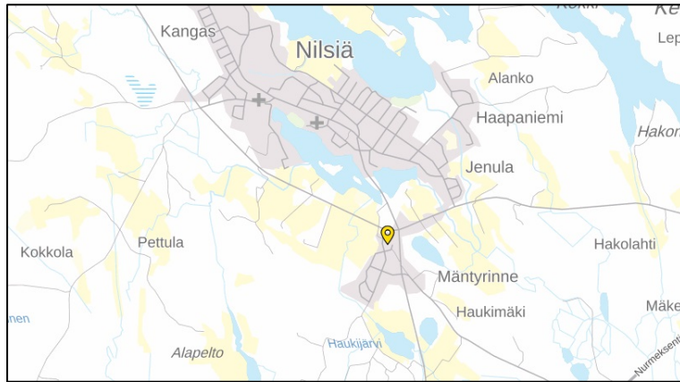
Tontin sijainti opaskartalla.