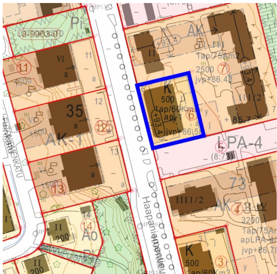
Tontti ajantasa-asekaavan kartalla.

Tontti on voimassa olevassa asemakaavassa osoitettu liike- ja toimistorakennusten korttelialueeksi (asemakaavamerkintä K). Tontin rakennusoikeus on 500 k-m 2 .