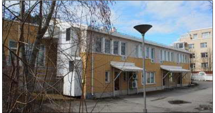
(A. Mustonen 9.4.2016)