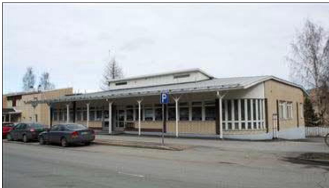
(A. Mustonen 9.4.2014)