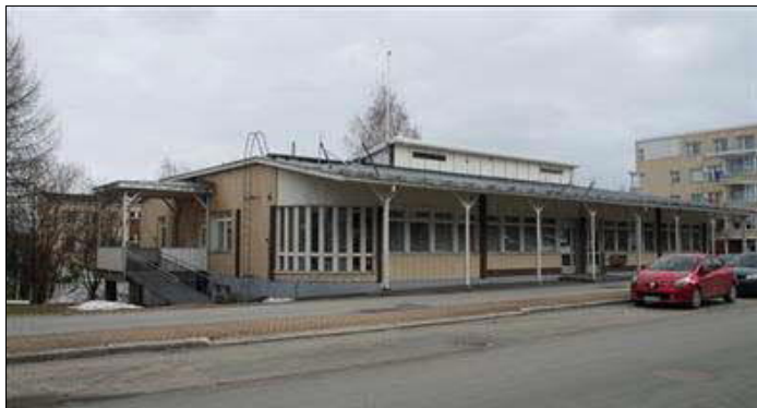
(A. Mustonen 9.4.2014)