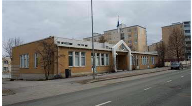
(A. Mustonen 9.4.2016)

id: 300442 rakennustunnus: 1028938714 rakennustyyppi: myymälä- ja liikerakennukset alkup. käyttö: 119 muut myymälärakennukset nyk. käyttö: 119 muut myymälärakennukset ajoitus: 1989 suunnittelija: Arkkitehtitoimisto Laitinen Ky kerrosluku: (1)+1 perustus: kantava ontelolaatta, kantava teräsbetonilaatta runko: puu, betoni vuoraus: julkisivutiili, muovipinnoitettu profiilipelti, sokkelissa betoni ulkoväri: vaeankeltainen, valkoinen, siniset yksityiskohdat kattomuoto: tasakatto, pulpettikatto kate: pelti, huopa? ikkunat: teräs, puu