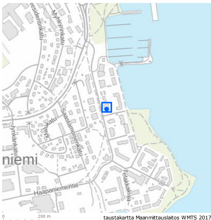
taustakartta Maanmittauslaitos WMTS 2017

id: 200246 kunta: Kuopio kylä: Haapaniemi kiinteistötunnus: 297-8-73-6 sijainti: Haapaniementie 10 tyyppi: liike-elämä ja kaupankäynti ajoitus: 1975- ajoituseläite: 1988 luokitus: *1-2/3 arvotus: paikallisesti arvokas inventoija: Aada Mustonen inventointipvm: 09.04.2016