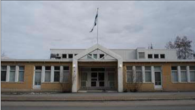
(A. Mustonen 9.4.2016)