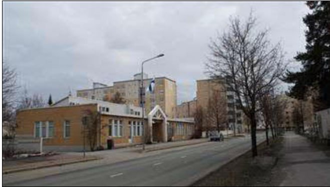
(A. Mustonen 9.4.2016)