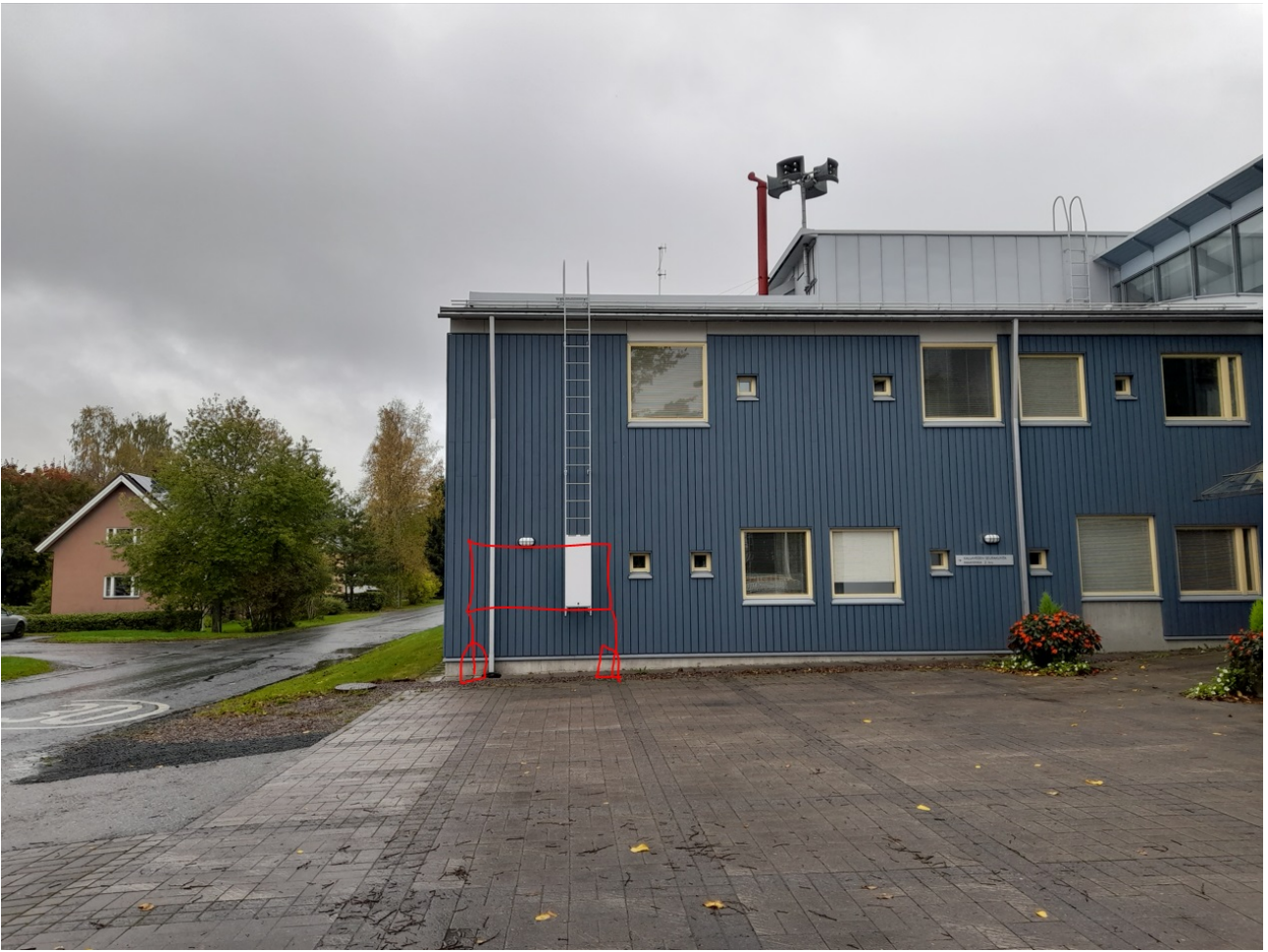
Liite 1: Havainnekuva ilmoitustaulun sijainnista (punaisella merkitty)