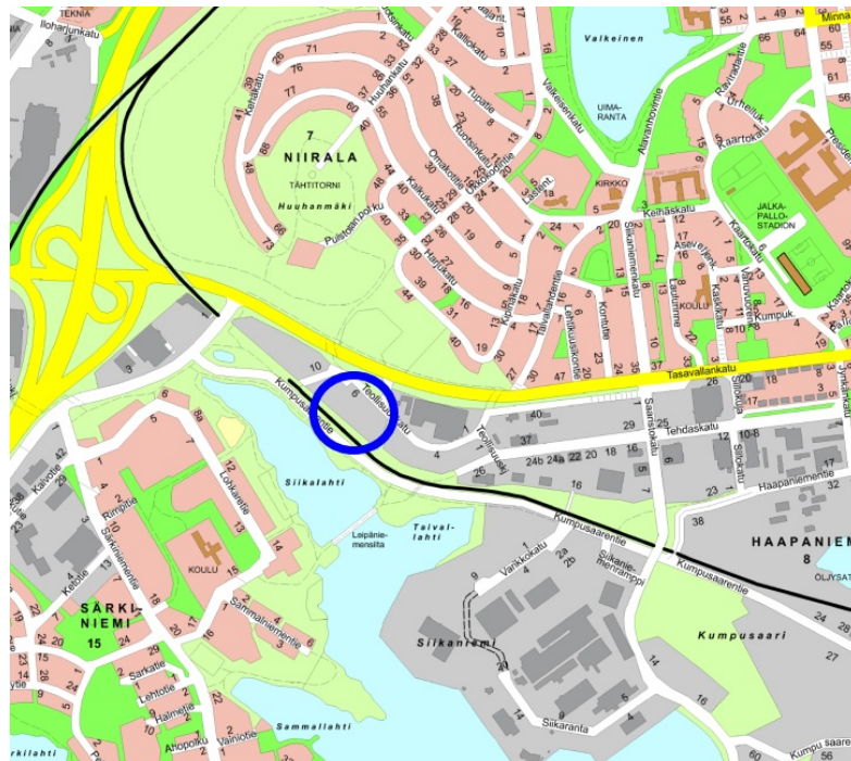
Tontin sijainti opaskartalla.

Liiketontti 297-8-69-6 on ollut varattu Tekova Oy Länsi-Suomelle 30.9.2024 asti. Neuvotteluiden mukaan yritys on valmis vuokraamaan tontin ja käynnistämään rakennushankkeen. Tontin sijainti on esitetty oheisissa kartoissa: