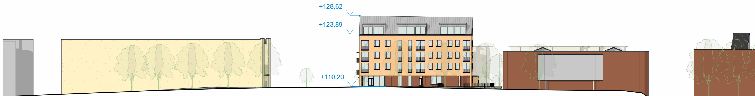
Katujulkisivu etelään 1 : 500