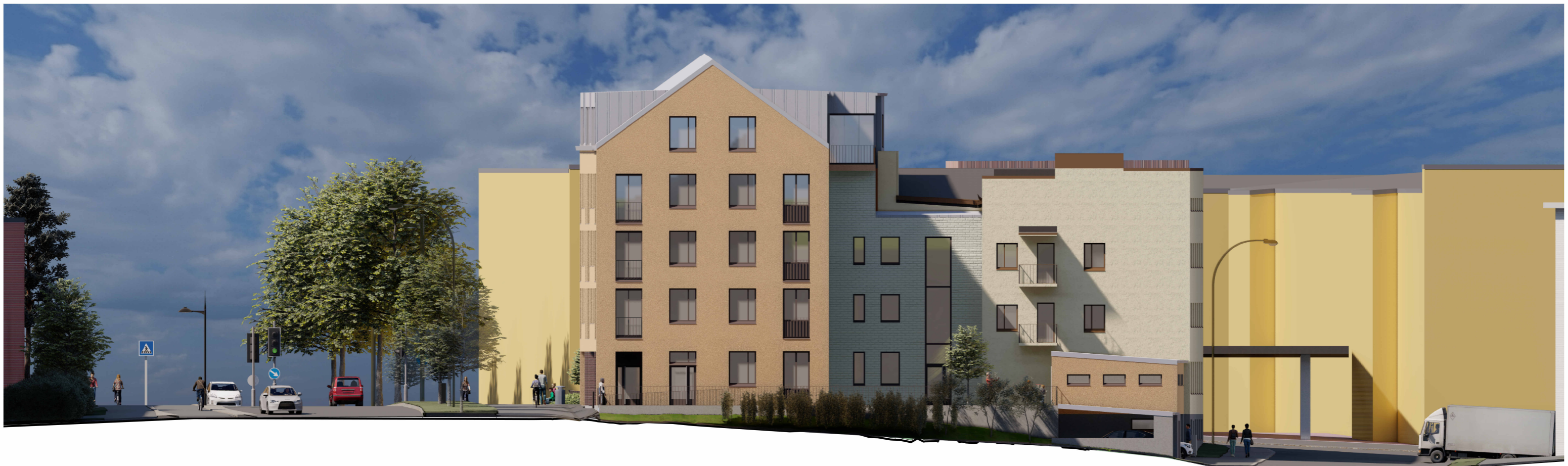
Julkisivu itään 1 : 200

Asemakaavan muutos Niiralankatu 13, 70100 KUOPIO