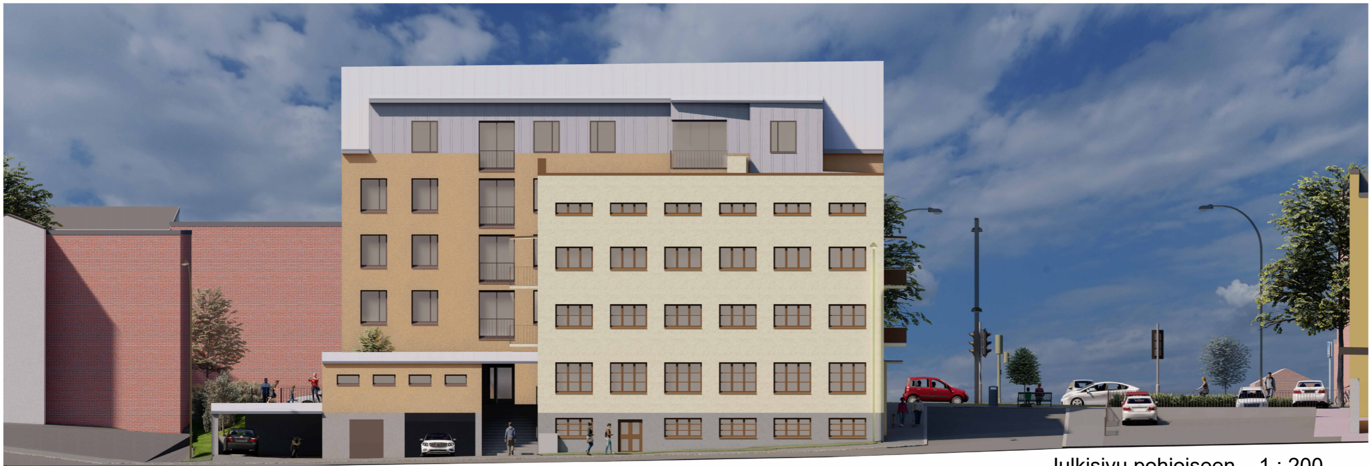
Julkisivu pohjoiseen 1 : 200