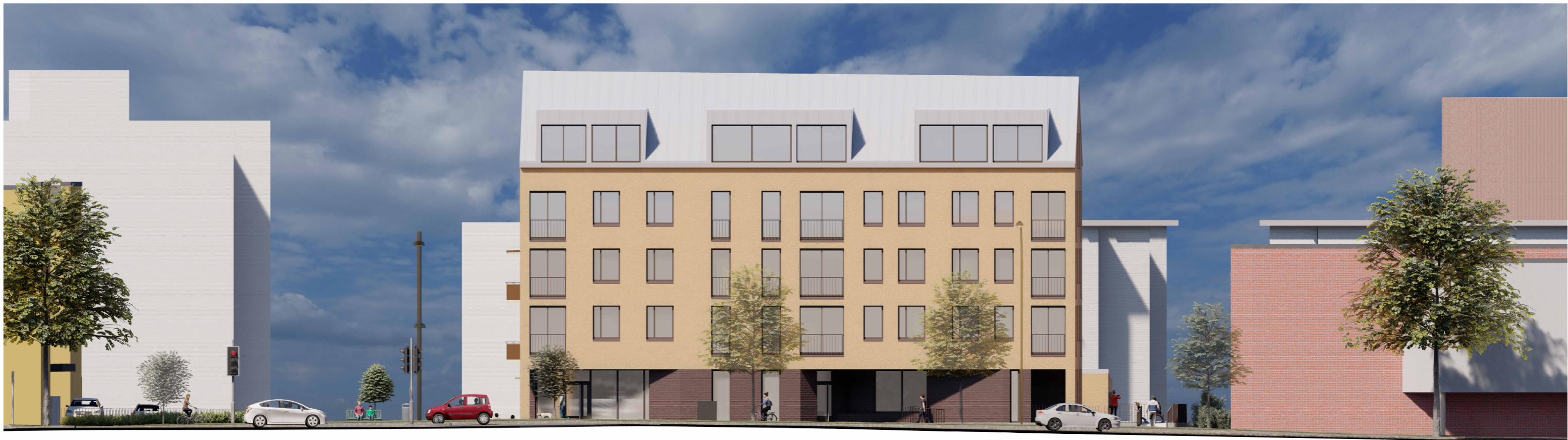
Julkisivu etelään 1 : 200