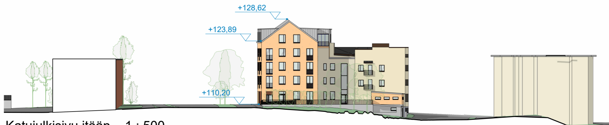
Katujulkisivu itään 1 : 500

Asemakaavan muutos Niiralankatu 13, 70100 KUOPIO