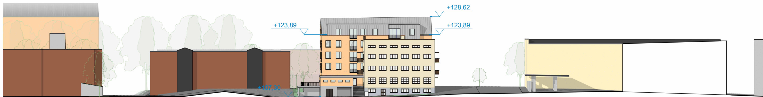
Katujulkisivu pohjoiseen 1 : 500