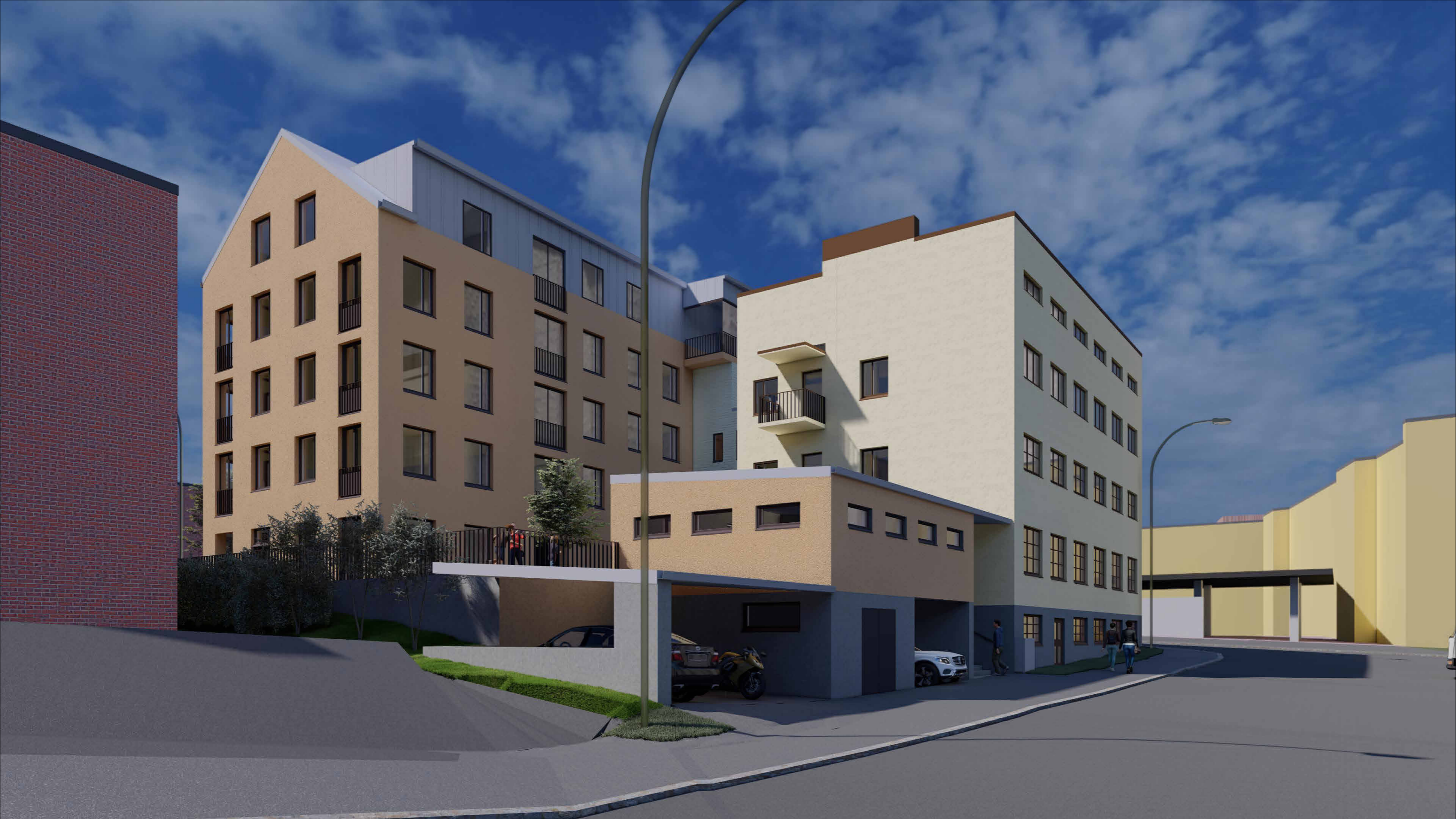
Havainnekuva koillisesta, Kultasepänkadulta

Asemakaavan muutos Niiralankatu 13, 70100 KUOPIO