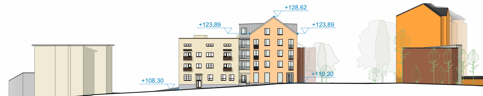
Katujulkisivu länteen 1 : 500