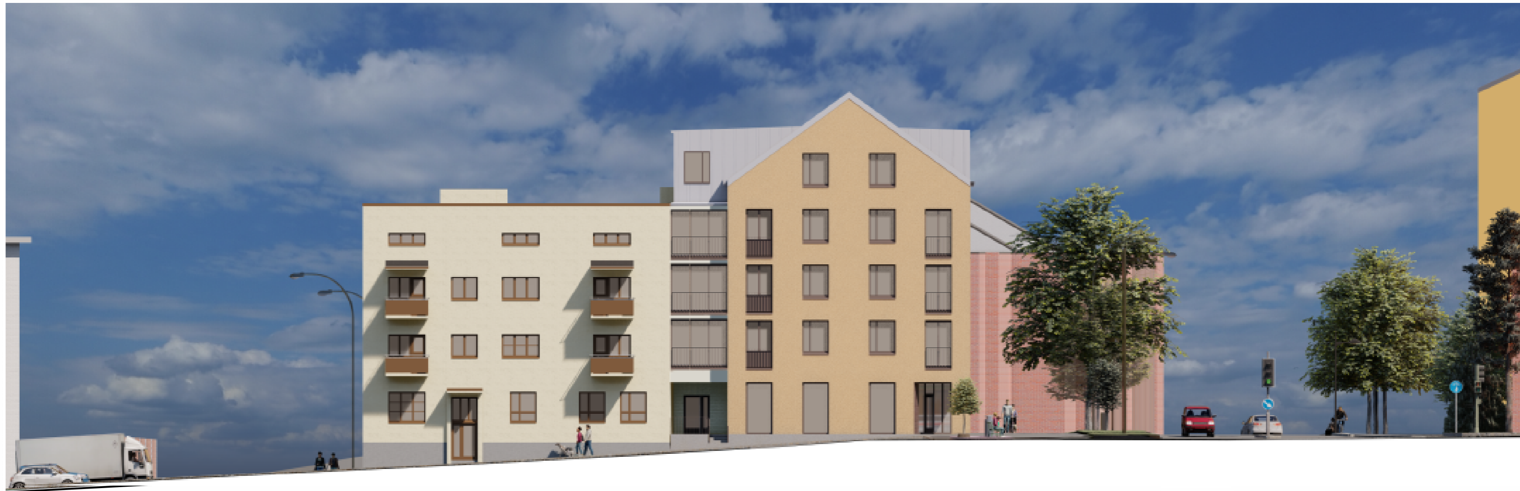
Julkisivu länteen 1 : 200

Asemakaavan muutos Niiralankatu 13, 70100 KUOPIO