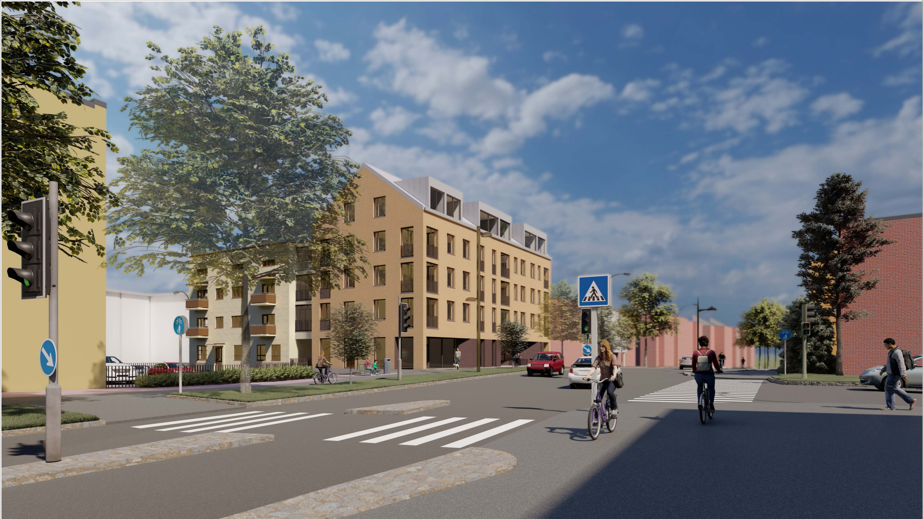
Havainnekuva lounaasta, Niiralankadulta

Asemakaavan muutos Niiralankatu 13, 70100 KUOPIO