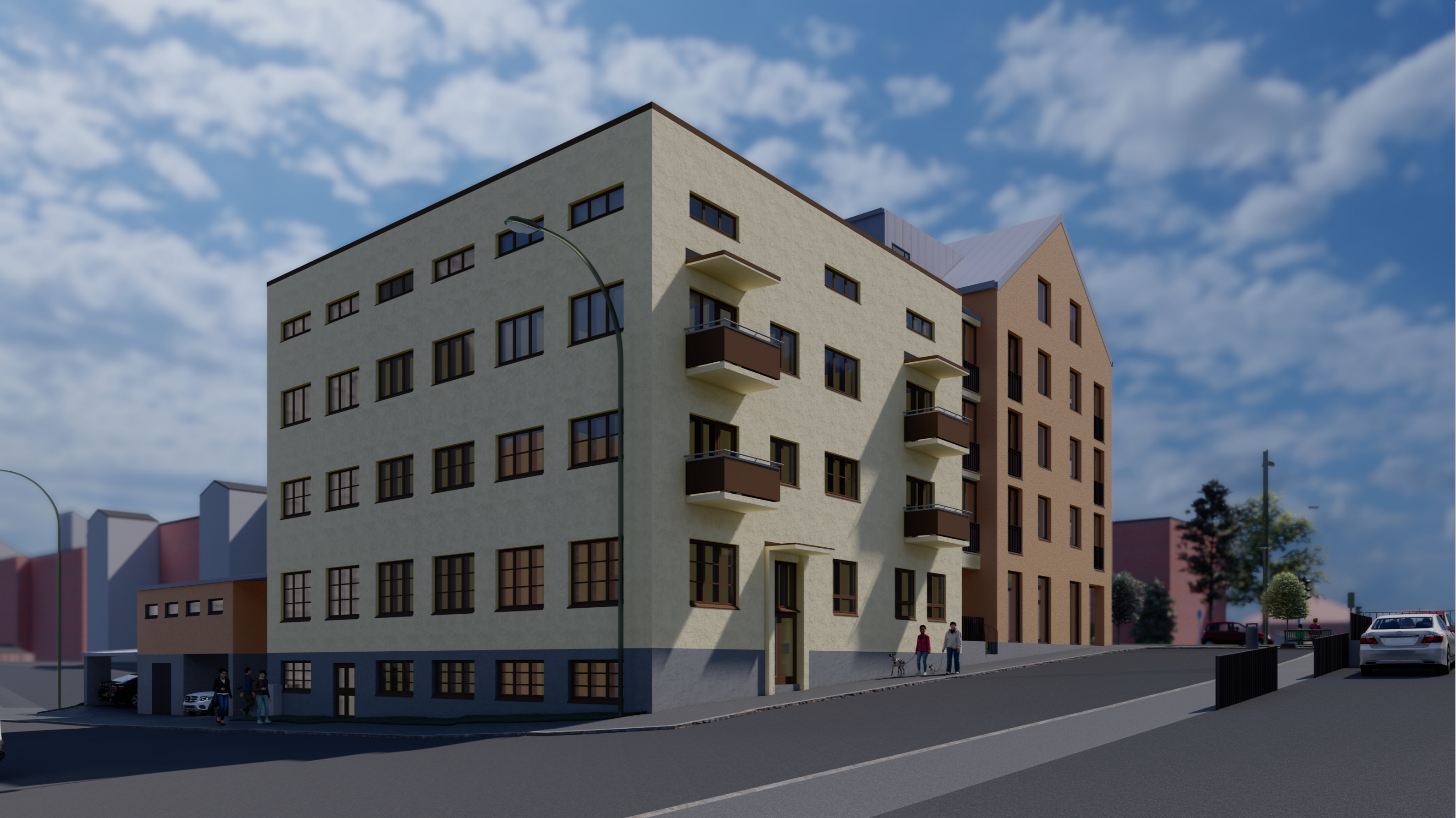
Havainnekuva luoteesta, Kultasepänkadulta

Asemakaavan muutos Niiralankatu 13, 70100 KUOPIO