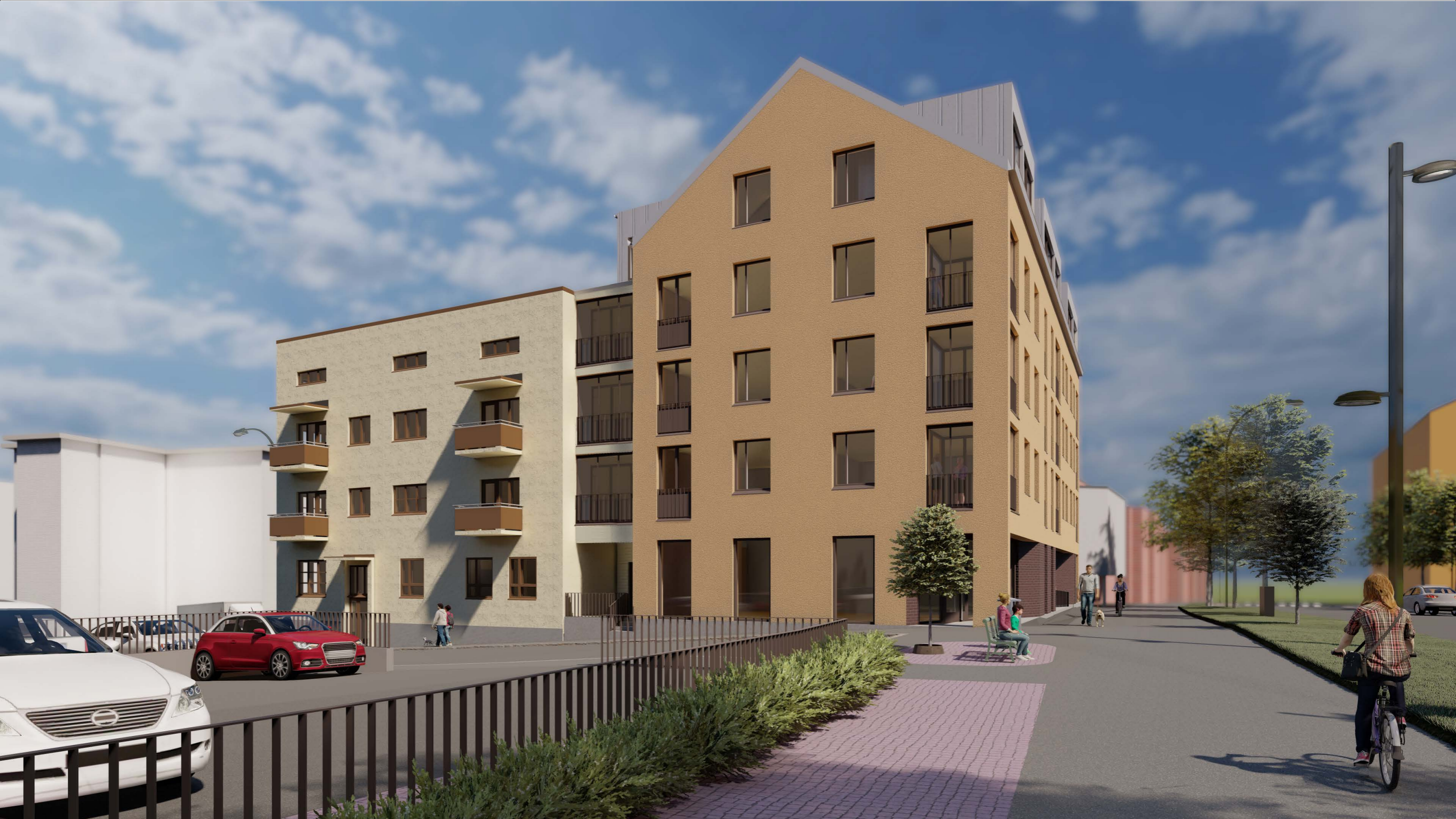
Havainnekuva lännestä, Niiralankadulta

Asemakaavan muutos Niiralankatu 13, 70100 KUOPIO