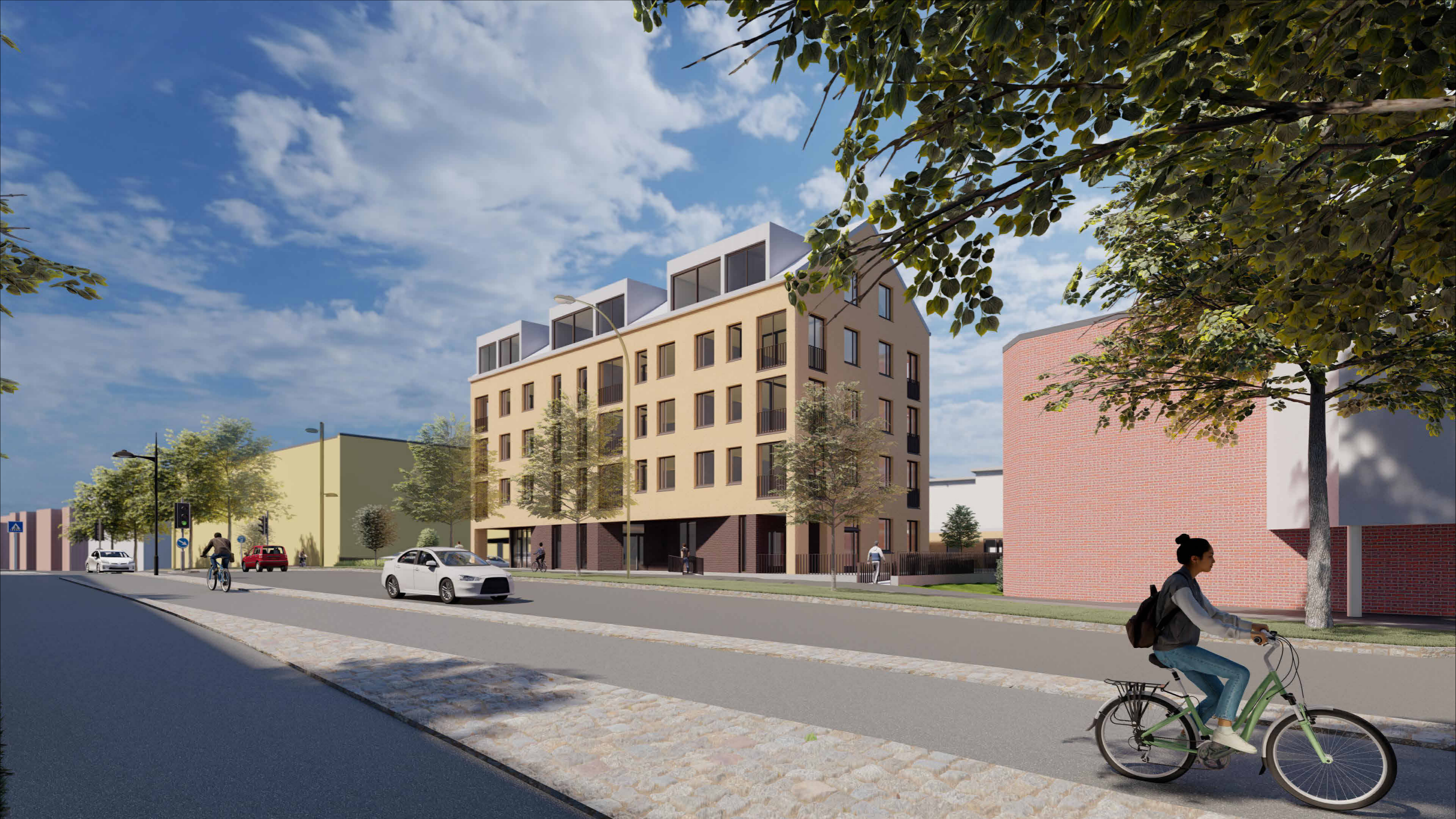
Havainnekuva kaakosta, Niiralankadulta

Asemakaavan muutos Niiralankatu 13, 70100 KUOPIO