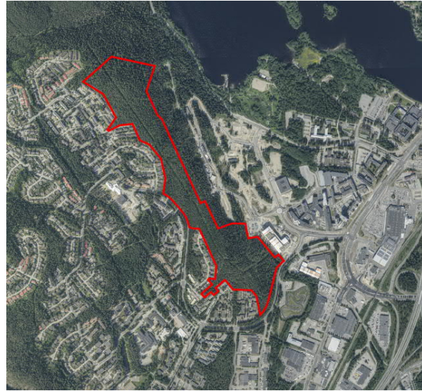
Kuva 2. Ilmakuva kaava-alueesta