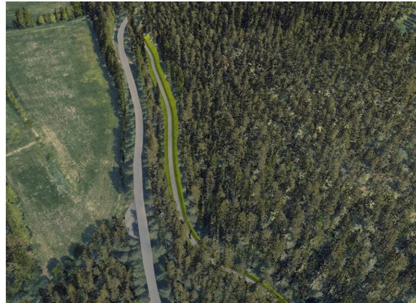
Tilanne puuston poiston jälkeen