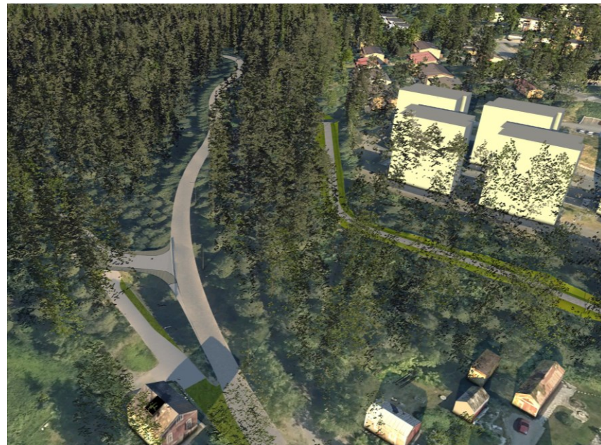
Tilanne puuston poiston jälkeen