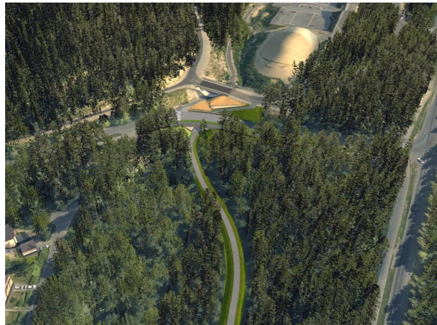
Tilanne puuston poiston jälkeen