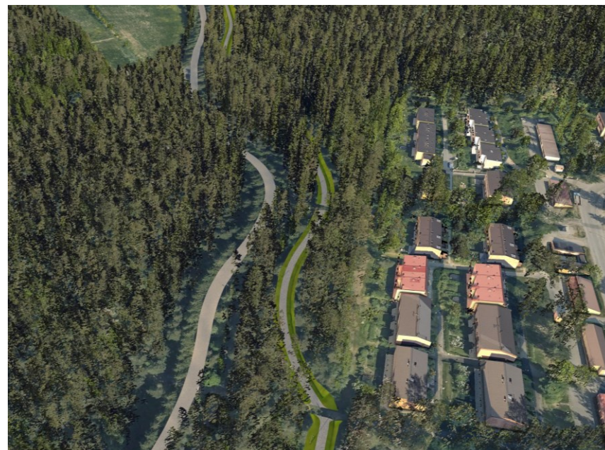
Tilanne puuston poiston jälkeen