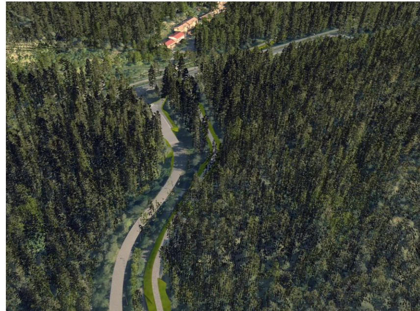
Tilanne puuston poiston jälkeen