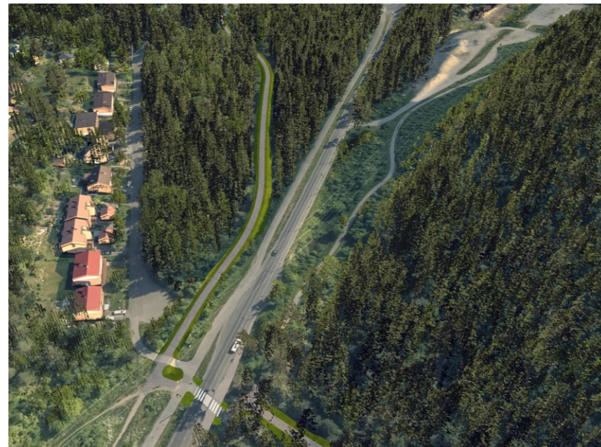
Tilanne puuston poiston jälkeen