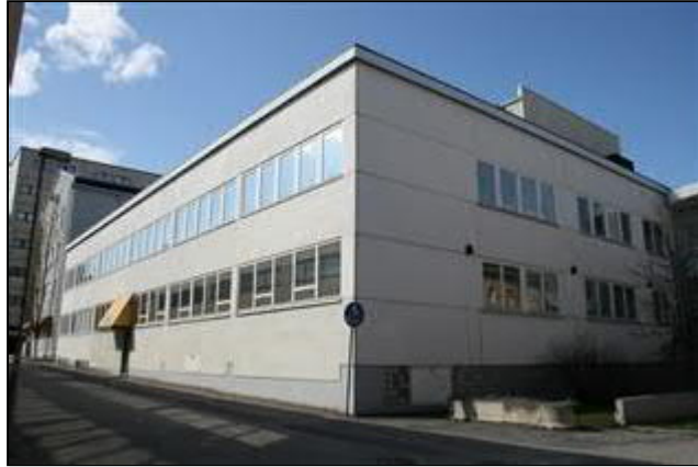
Kirjapainosiipi Kirjastokadun ja Puusepänkadun risteyksestä kuvattuna.