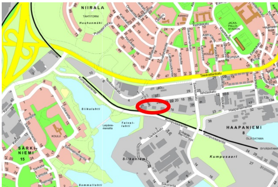
Tontin sijainti esitettyä opaskartalla.