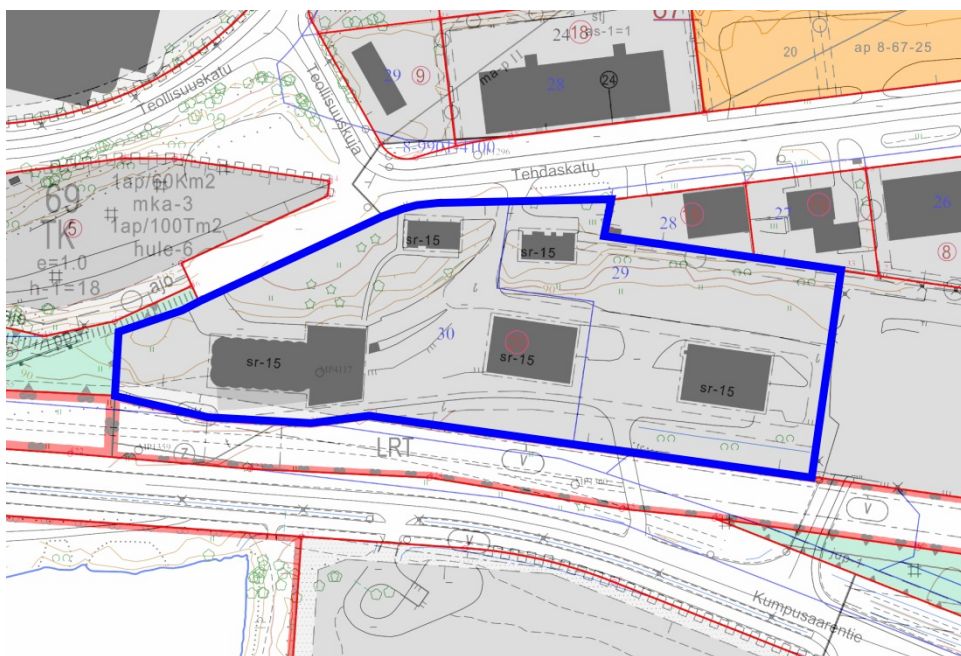
Tontin sijainti esitettyä ajantasa-asemakaavan kartalla.

Tontin 297-8-69-20 pinta-ala on 17 297 m 2 . Tontti on voimassa olevassa asemakaavassa osoitettu teollisuus- ja varistorakennusten korttelialueeksi (kaavamerkintä T-3). Tontille on asemakaavassa osoitettu rakennusoikeutta yhteensä 17 297 k-m 2 . Tontilla olevat rakennukset on asemakaavassa määritelty kulttuurihistoriallisesti arvokkaiksi eikä niitä saa purkaa.