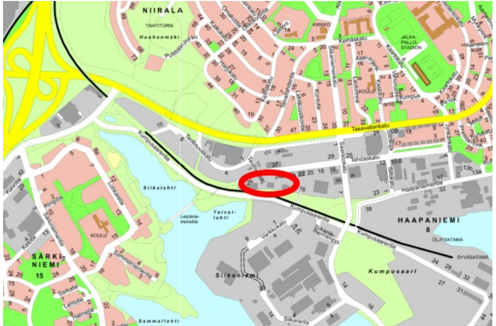
Tontin sijainti esitettyä opaskartalla.