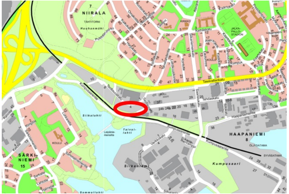
Tonttien sijainti esitettyä opaskartalla.