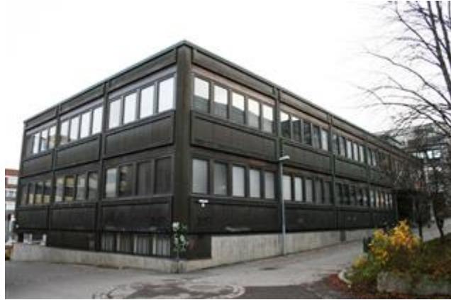
Rakennus Hapelähteenkadun ja Puusepänkadun risteyksestä kuvattuna.