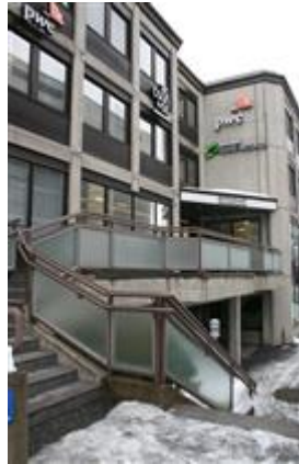
(Aada Mustonen 8.3.2015)