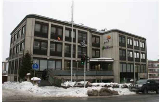
(Aada Mustonen 8.3.2015)