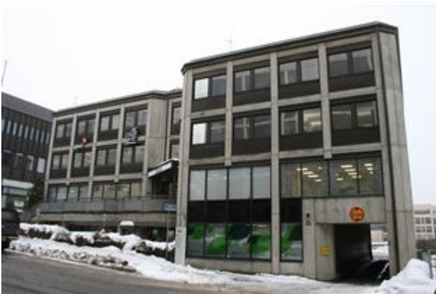
(Aada Mustonen 8.3.2015)