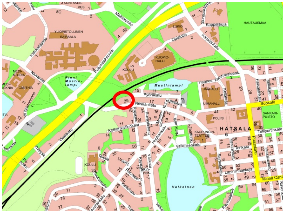
Tontin sijainti opaskartalla.

Selostus Kiinteistö Oy Kuopion Tukkukartano hallitsee maanvuokrasopimuksen nojalla osoitteessa Niiralankatu 25 sijaitsevaa yritystonttia 297-7-18-3. Maanvuokrasopimus päättyy 31.12.2024. Tontin sijainti on osoitettu seuraavissa kartoissa.