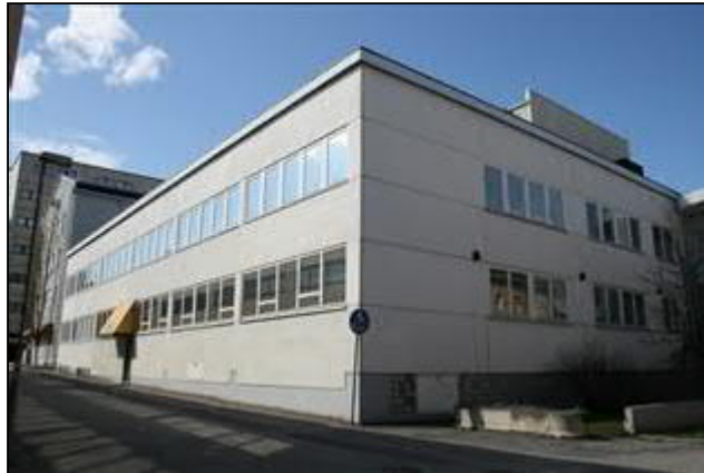
Kirjapainosiipi Kirjastokadun ja Puusepänkadun risteyksestä kuvattuna. (Aada Mustonen 5.5.2015)