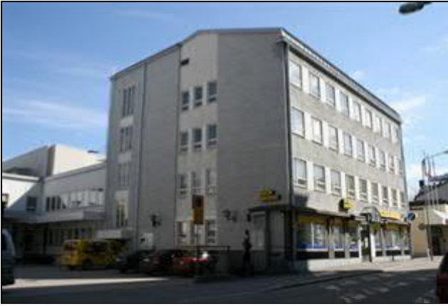
(Aada Mustonen 4.5.2015)