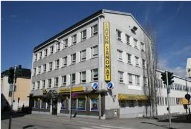
Savon Sanomien toimitalo Vuorikadun varrelta kuvattuna. (Aada Mustonen 5.5.2015)