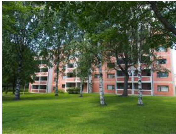
A-rakennus Tasavallankadulta.