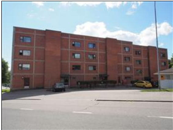
A-rakennus Jynkänkadulta.