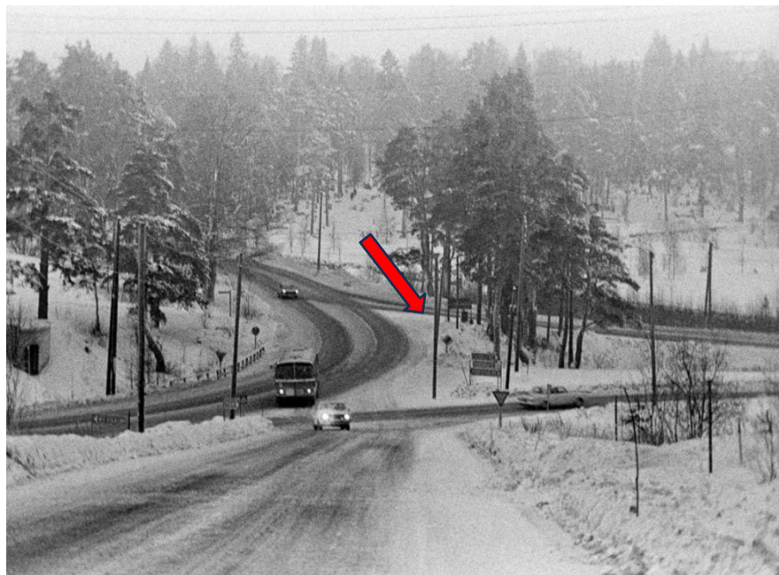
Merkkikiven risteys 1971. Merkkikiven kohta merkitty nuolella. (heikkipuu.kuvat.fi)