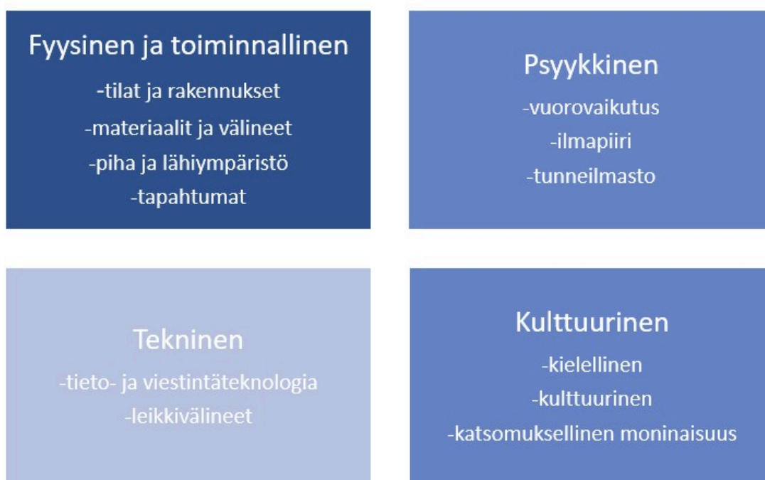
Kuvio 3. Pedagoginen oppimisympäristö.