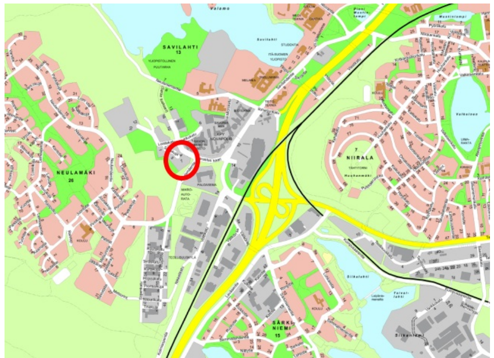
Tonttien sijainti esitettyinä opaskartalla.

Yritys on ilmoittanut tahtonsa ostaa tontit 297-13-30-4 ja 297-13-30-1. Tonttien sijainnit on esitetty oheisissa kartoissa.