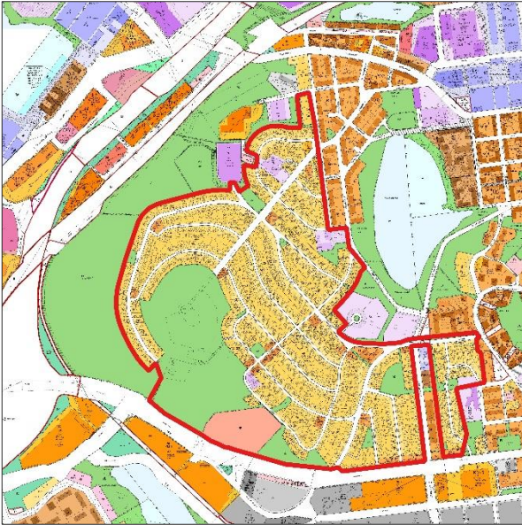
Kuva 5. Ote ajantasa-asemakaavasta

Voimassa olevia kaavoja voi tarkastella kaupungin karttapalvelussa http://karttapalvelu.kuopio.fi