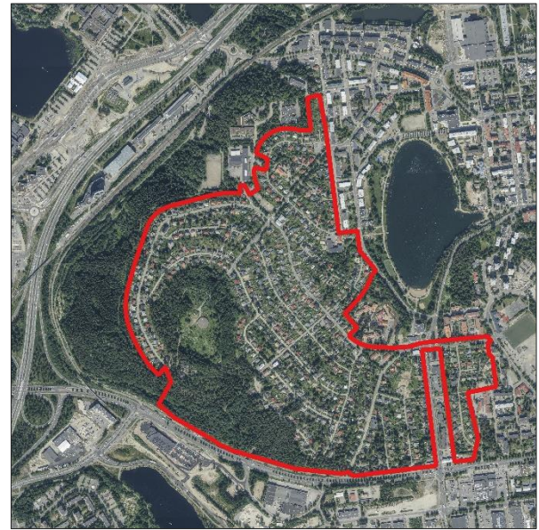
Kuva 2. Ortokuva (2023), kaava-alueen rajaus