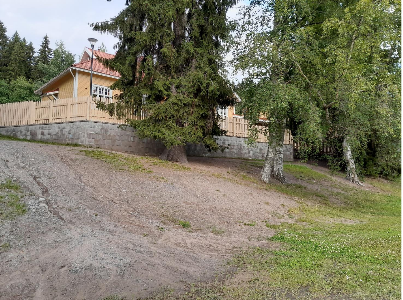
Kuva 1. Päiväkodin aidattua piha-aluetta.

Tontilla on sekä rakennettua aluetta että enemmän luonnontilaisen kaltaista aluetta. Päiväkodin ajopiha on asfaltoitu ja päiväkodin aidatut alueet ovat nurmi/hiekkapihaa. Kuvassa 1 on näkymä päiväkodin urheilualueelta vanhalle hirsirakennukselle päin.