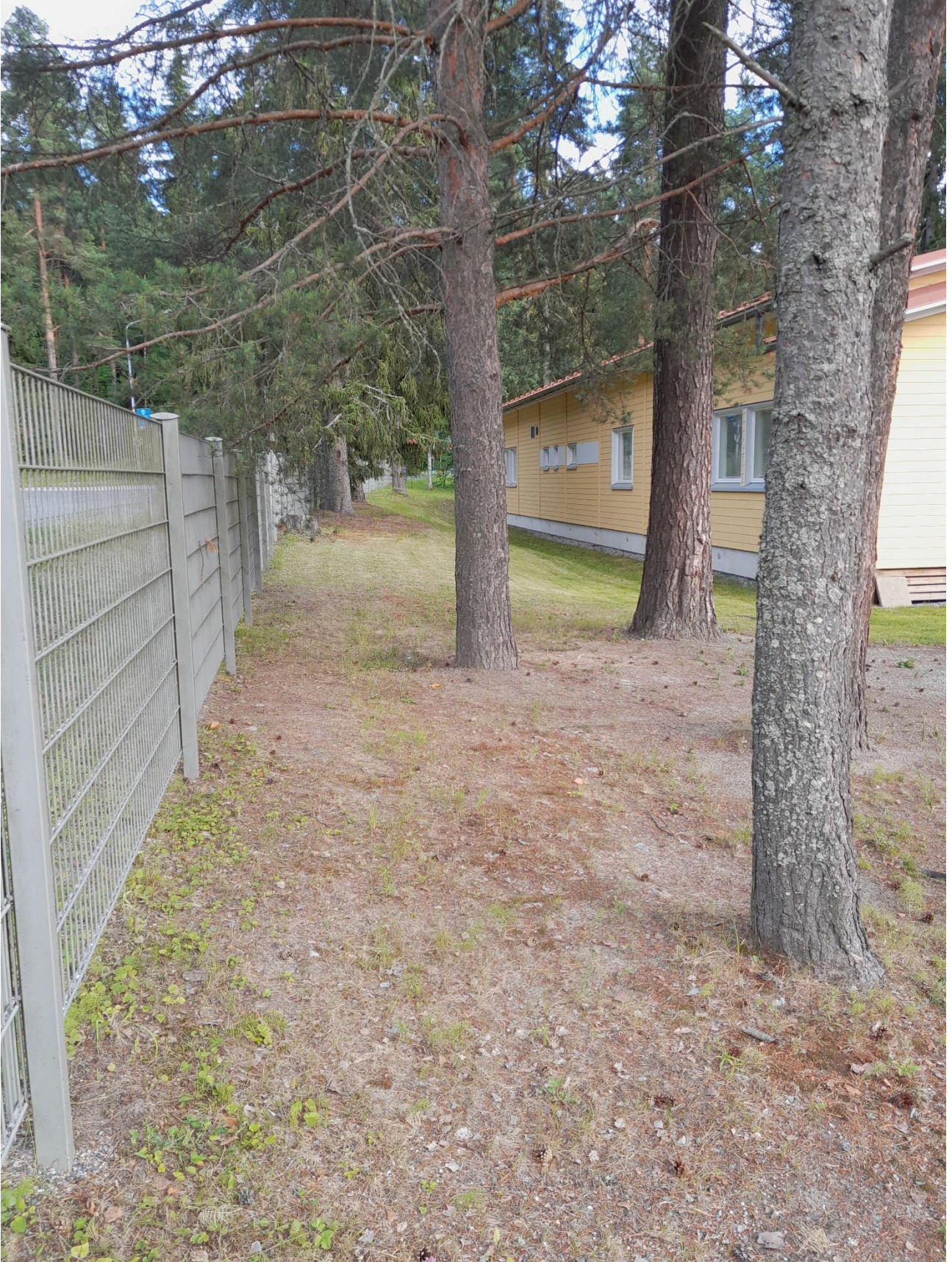
Kuva 2. Piha-alueita Suurmäentien varrella.