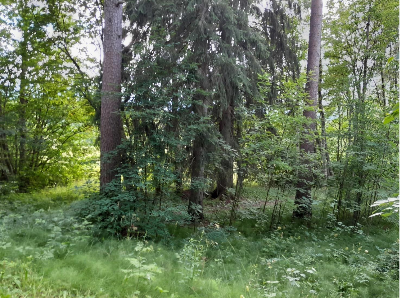
Kuva 4. Tontin kaakkoisosan luonnontilaista kasvillisuutta.

Alueella kasvaa muutamia isoja kuusia sekä mäntyjä. Pihlajia ja harmaaleppiä kasvaa pellon vieressä. Alueen poikki johtaa polku kevyenliikenteen väylältä päiväkodin aidatulle portille.