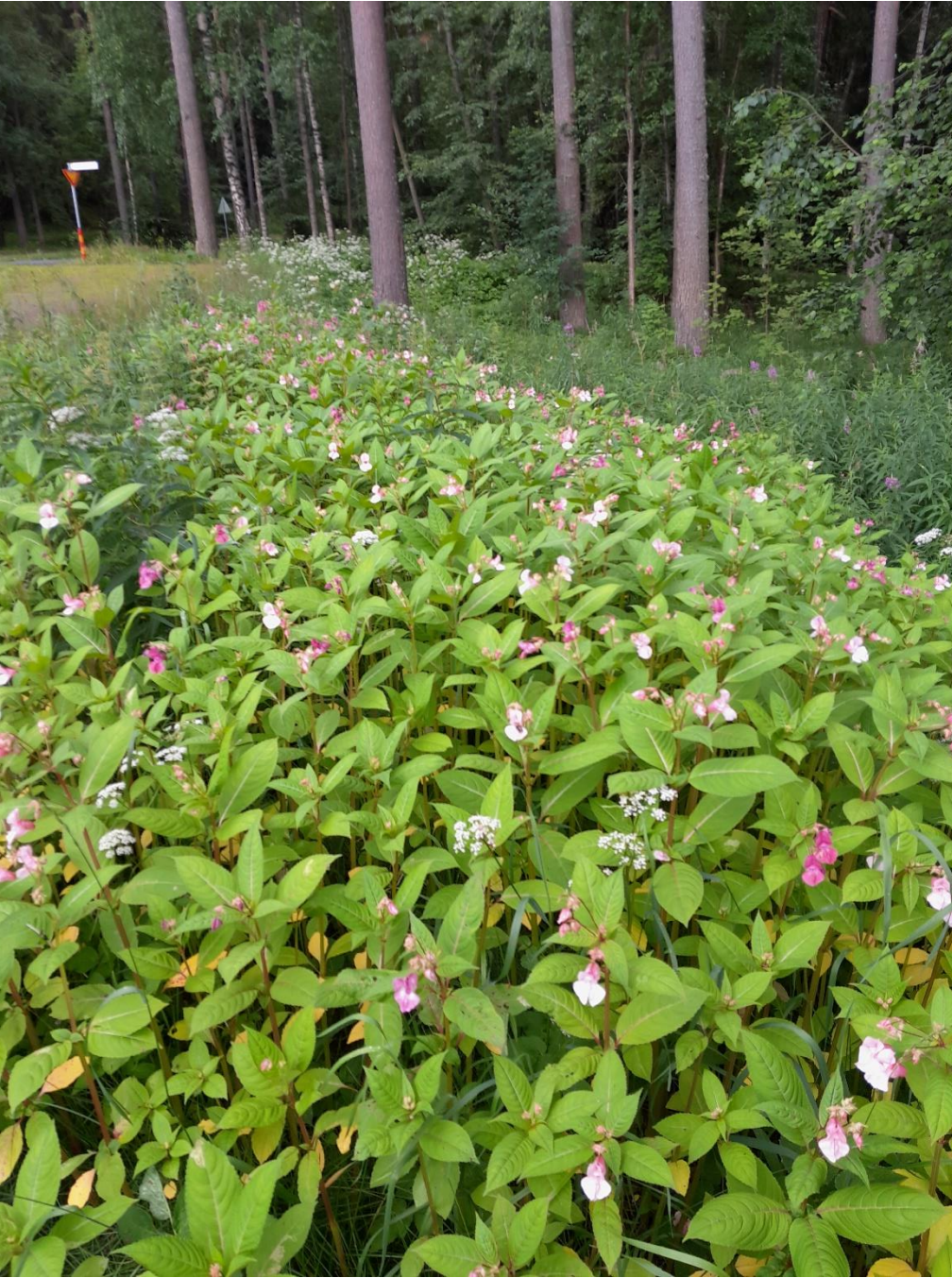
Kuva 5. Jättipalsamikasvustoa.

Päiväkodin tontilla tehtiin liito-oravakartoitus keväällä 2022. Tämän luontoselvityksen maastokäynnin (18.7.2022) yhteydessä havaittiin yhden kuusen tyveltä liito-oravan papanoita, kuva 6. Kuusi oli sama, jolta löytyi myös keväällä papanoita. Nyt heinäkuussa havaitut papanat vaikuttivat olevan vielä tuoreita.