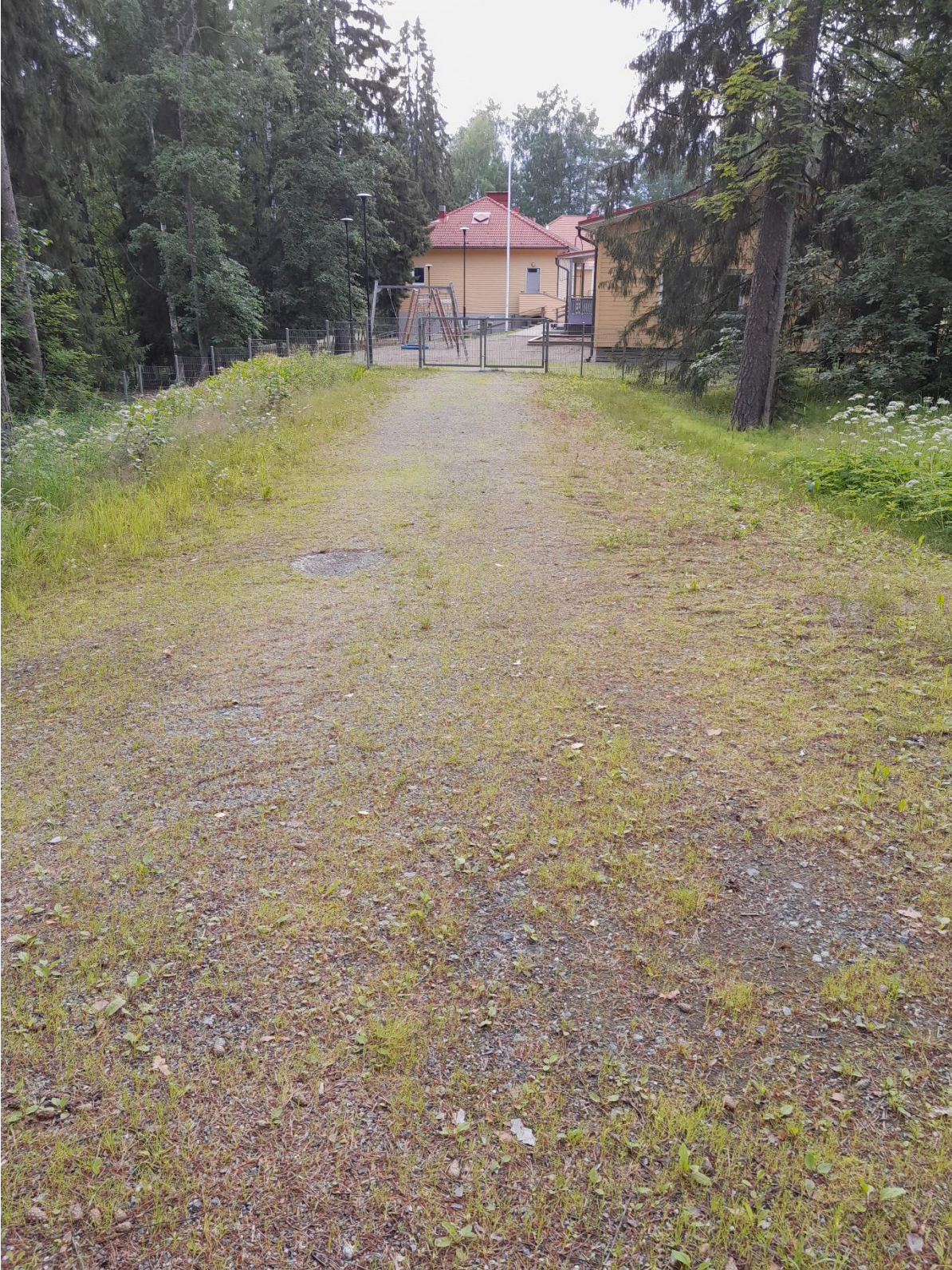
Kuva 3. Hiekkatie.

Kartoitettavan alueen kaakkoisosassa on enemmän luonnontilaista maastoa. Vieressä kulkevalta kevyen liikenteen väylältä johtaa hiekkatie päiväkodin tontille, kuva 3. Hiekkatien ja Suurmäentien kulmauksessa valtalajeina on vuohenputki ja peltokorte.