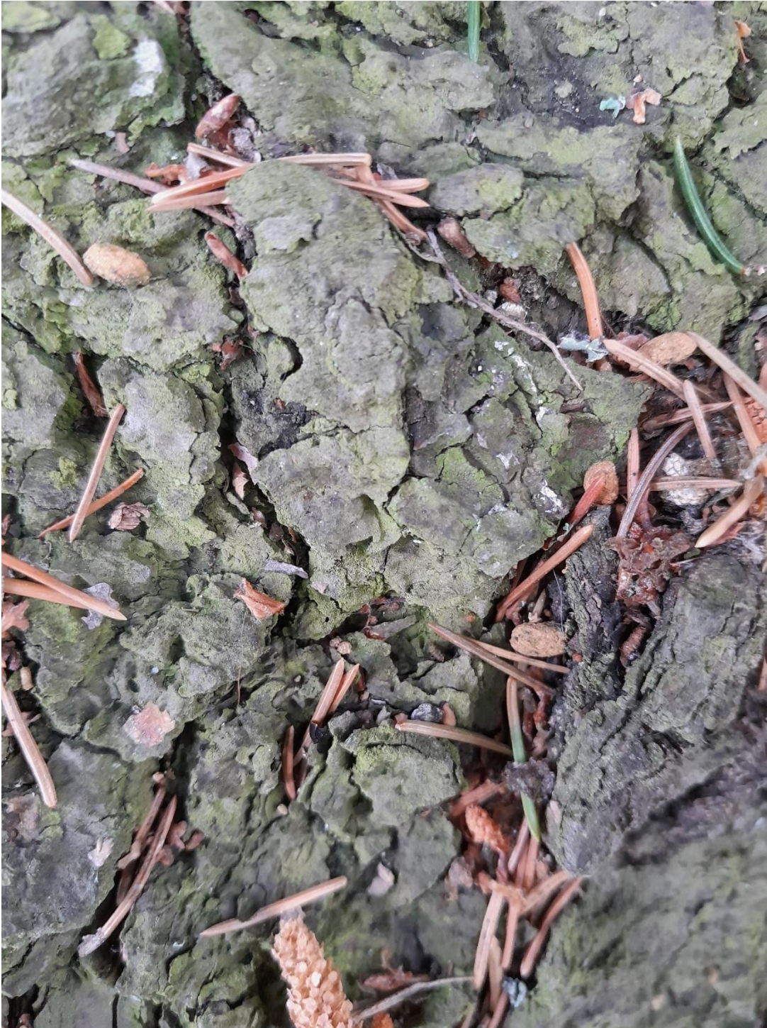
Kuva 6. Liito-oravan papanoita kuusen tyvellä.