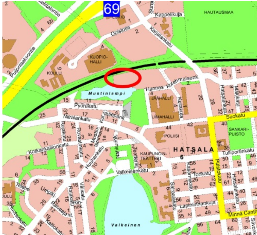
Tontin sijainti esitettynä opaskartalla.