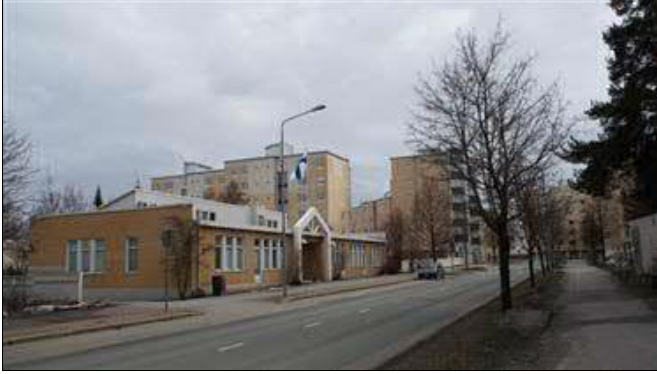
(A. Mustonen 9.4.2016)