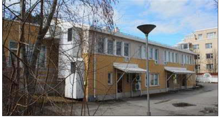
(A. Mustonen 9.4.2016)