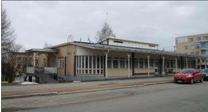
(A. Mustonen 9.4.2014)