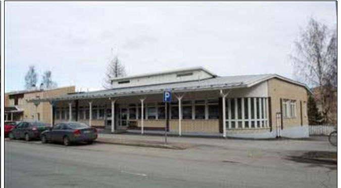
(A. Mustonen 9.4.2014)