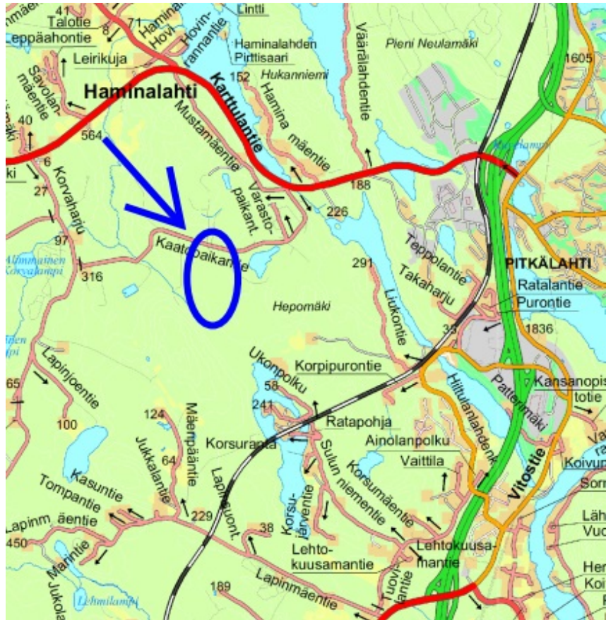
Alueen sijainti esitettyä opaskartalla.