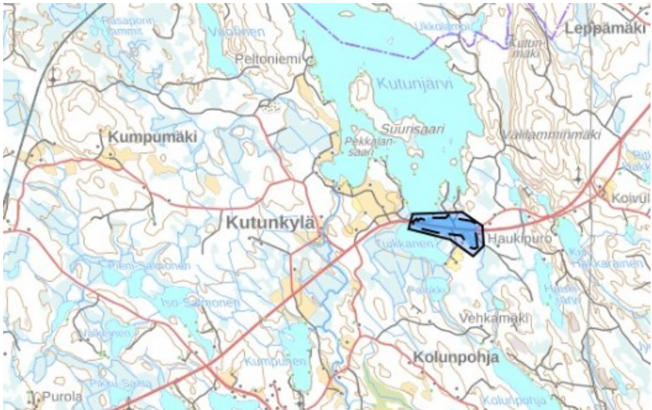
Tuikkasenkangas, 0877804, luokka 2