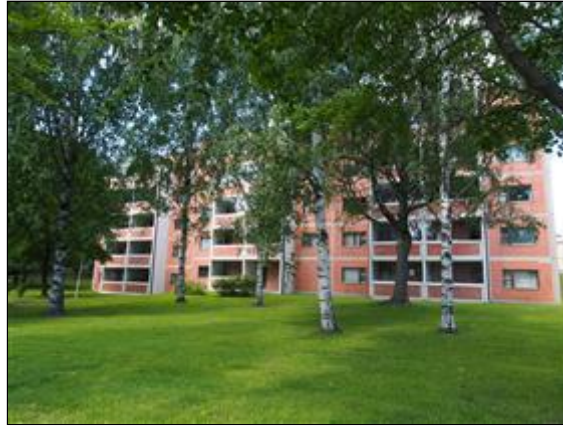
A-rakennus Tasavallankadulta.