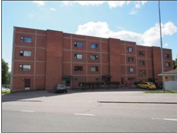
A-rakennus Jynkänkadulta.