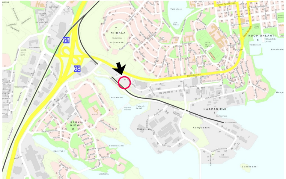
Tontin sijainti opaskartalla.