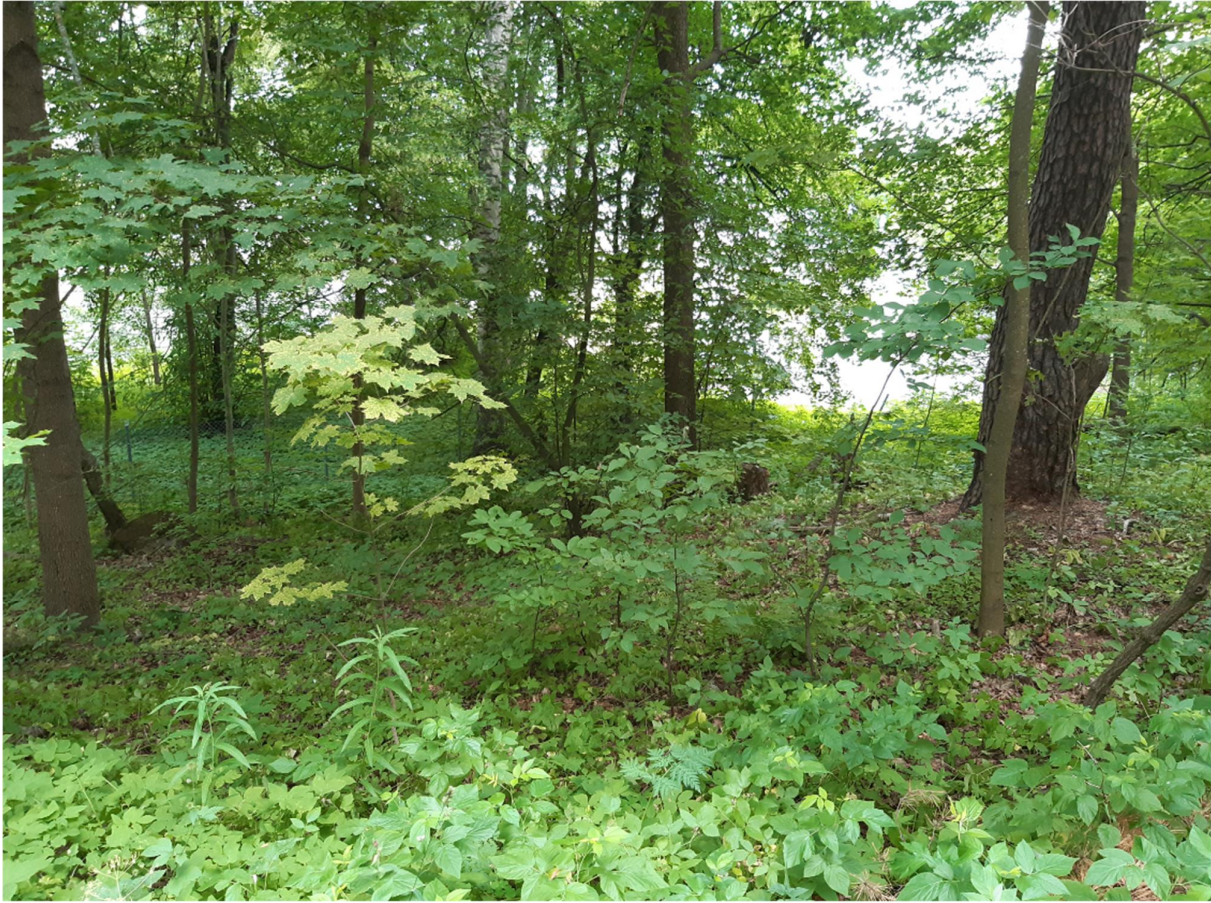
Kuva 3. Aluskasvillisuutta kuviolta 1, kävelytieltä länteen päin.

Kävelytien itäpuolella puusto on pääosin kookasta mäntyä, jossa sekapuuna nuorehkoa haapaa, harmaaleppää ja vaahteraa. Paikoin myös nuorta pihlajaa.