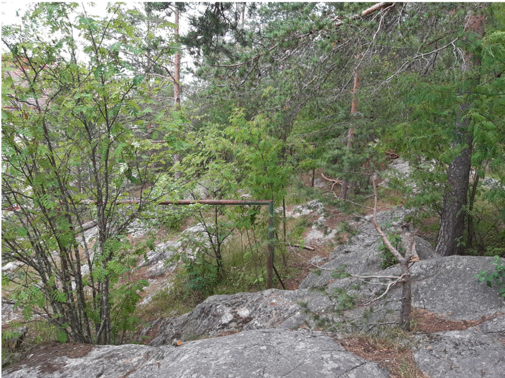
Kuva 7. Näkymä kallioilta