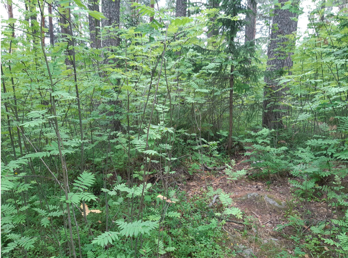
Kuva 9. Mustikkatyyppin tuoretta kangasta

Mustikkatyyppin tuoreen kangasmetsän pääpuulaji on kookas mänty. Sekapuuna kasvaa myös vaahteraa, tuomea ja leppää. Nuorta pihlajaa kasvaa kaikkialla huomattavan paljon.