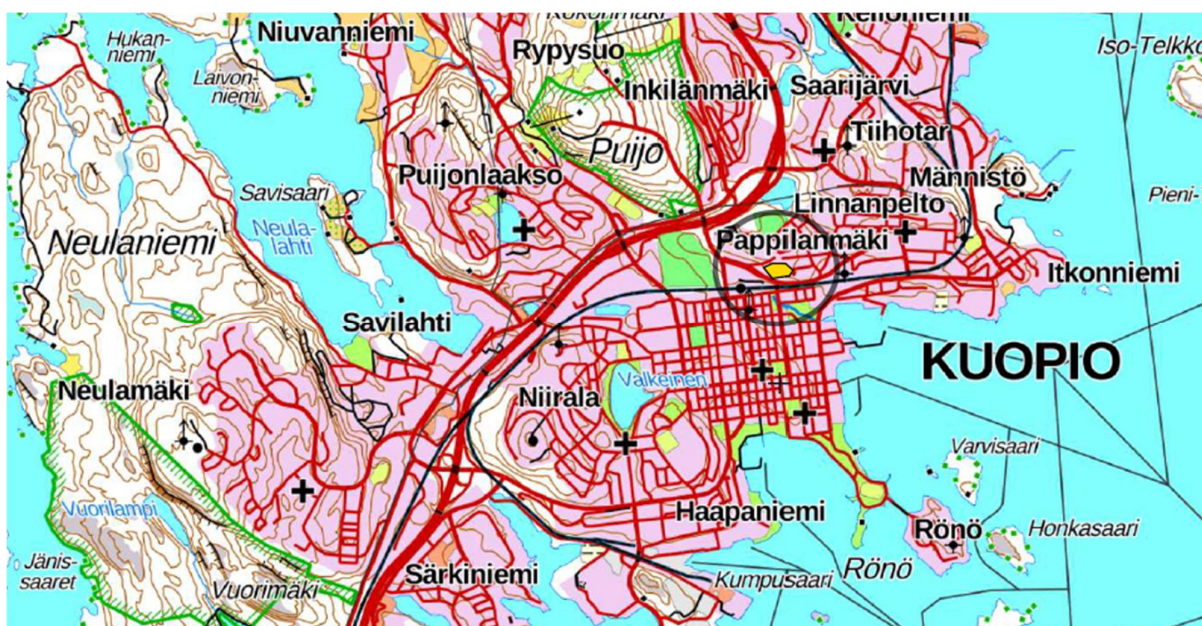
Kuva 1. Lähestymiskartta alueen sijainnista

Koko alue on kasvillisuudeltaan voimakkaasti kulttuurivaikutteinen.