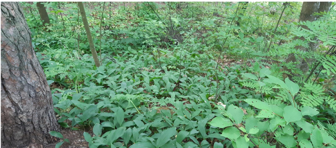
Kuva 5. Alueen itäpuolen lehdon kasvustoa

Alueella kasvaa suurikokoisia mäntyjä, sekä lisäksi nuorehkoja lehtipuita, mm. vaahtera ja tuomi.