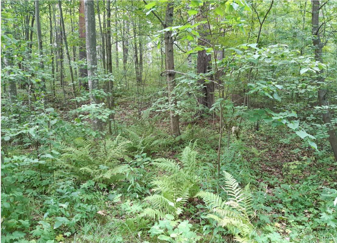
Kuva 4. Alueen läpi kulkevan kävelytien itäpuoli

Alueen itäisimmässä osassa lehto on kulttuurivaikutteista. Alueella tavataan monia puutarhoista karanneita kasveja mm. akileija, vuohenkello, sinivuokko ja punaherukka. Luonnonvaraisina alueella kasvaa muun muassa mustakokkonmarjaa sekä lisäksi muun muassa käenkaalia ja kieloa.