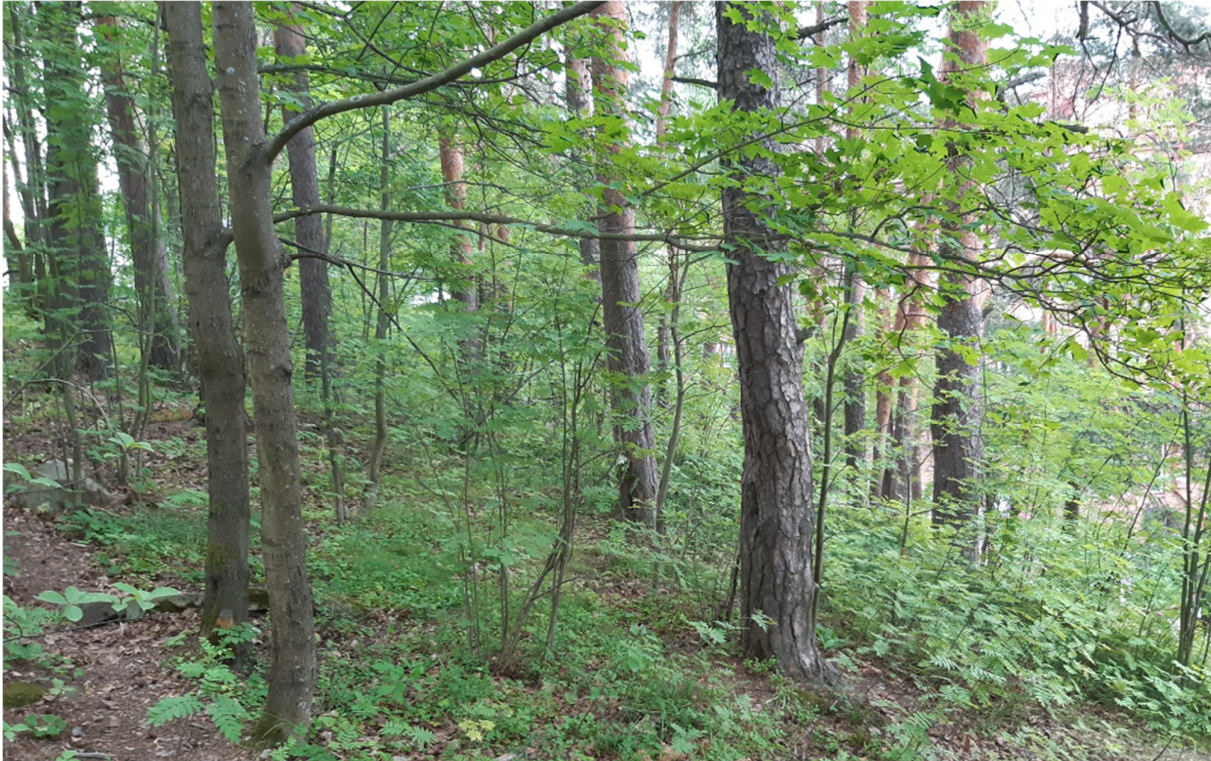
Kuva 6. Näkymä alueen itäosan tuoreesta lehdestä.