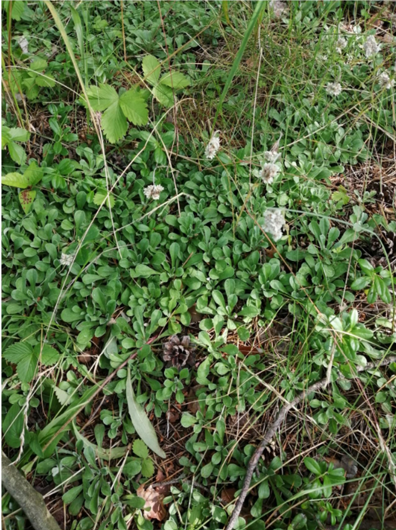
Kuva 8. Kissankäpälää kuviolla 2

Kasvilajiston kulttuurivaikutuksesta kertoo kallioilla useissa paikoissa kasvava mehitähti. Kissankäpälää (NT) kasvaa kallioalueen länsiosassa.