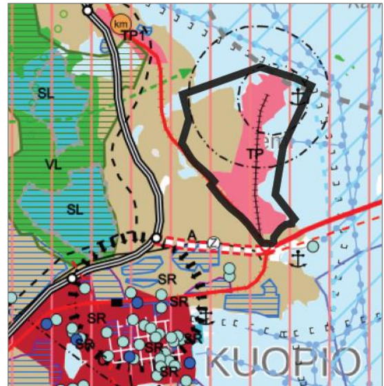
Kuva 2 Suunnittelualueen rajaus ja ote Kuopion seudun maakuntakaava (2008)

Ympäristöministeriön 1.6.2016 vahvistamassa Pohjois-Savon kaupan maakuntakaavassa 2030 Kelloniemen alueella on Seveso II- direktiivin mukaisia tuotantolaitosten suojavyöhykkeet sv- 11 812 ja sv- 11 815.