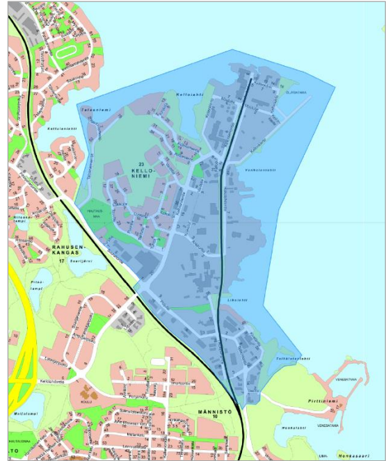
Kuva 1 Osayleiskaava-alue. Opaskartta (C) Kuopion kaupunki (2023).

Kelloniemen osayleiskaavasta tulee oikeusvaikutteinen ja se tulee vahvistuessaan kumoamaan kaava-alueen osalta kaupunginvaltuuston 11.12.2000 hyväksymän Kuopion keskeisen kaupunkialueen yleiskaavan. Laadittavalla osayleiskaavalla ratkaistaan alueen yleispiirteinen maankäyttö ja liittyminen muuhun kaupunkirakenteeseen. Osayleiskaava ohjaa alueen tulevaa asemakaavoitusta ja muuta yksityiskohtaista suunnittelua.