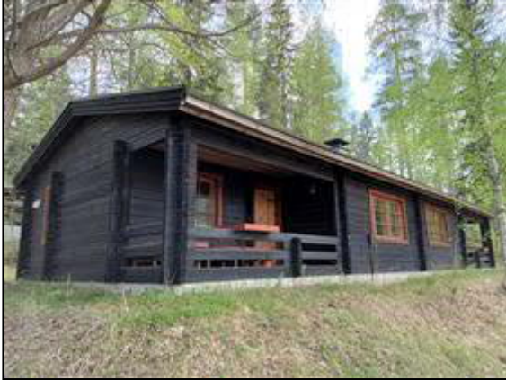
Bungalow IV. ( 17.05.2021)