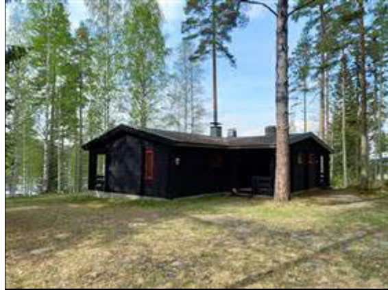
Bungalow II.