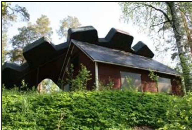
Eteläsivu.