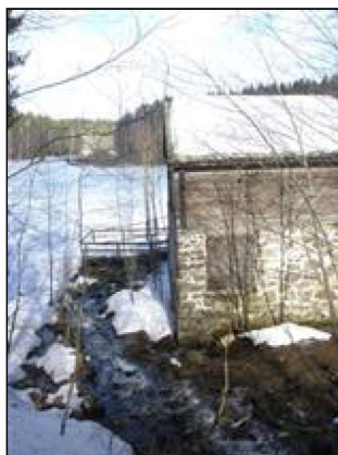
(Matti Asikainen 2.4.2015)