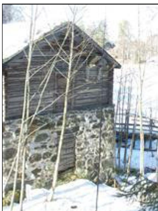
(Matti Asikainen 2.4.2015)