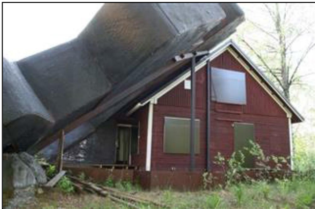
Länsipääty.