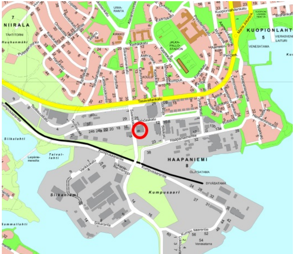
Tontin sijainti esitettyä opaskartalla.