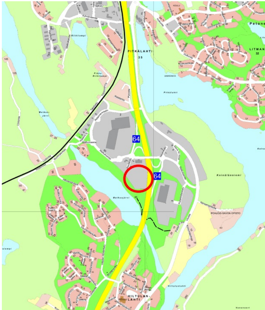
Tontin sijainti esitettynä opaskartalla.