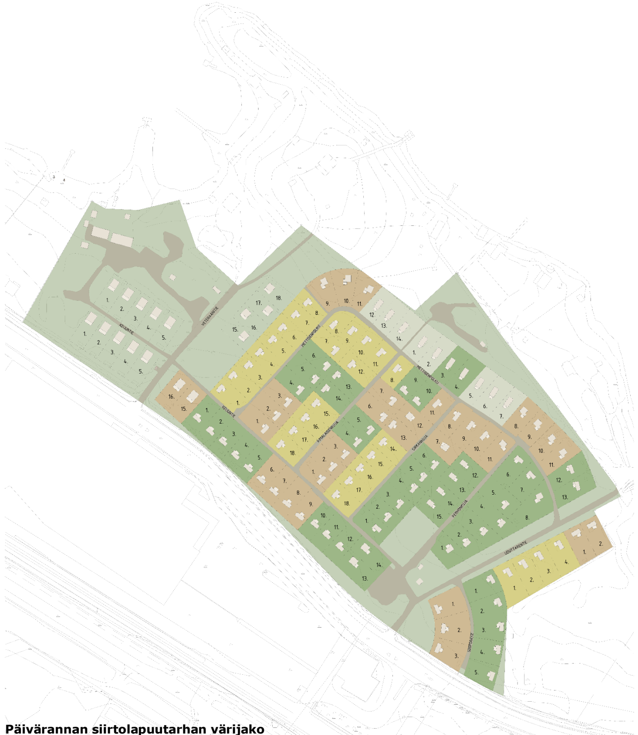
Päivärannan siirtolapuutarhan värijako