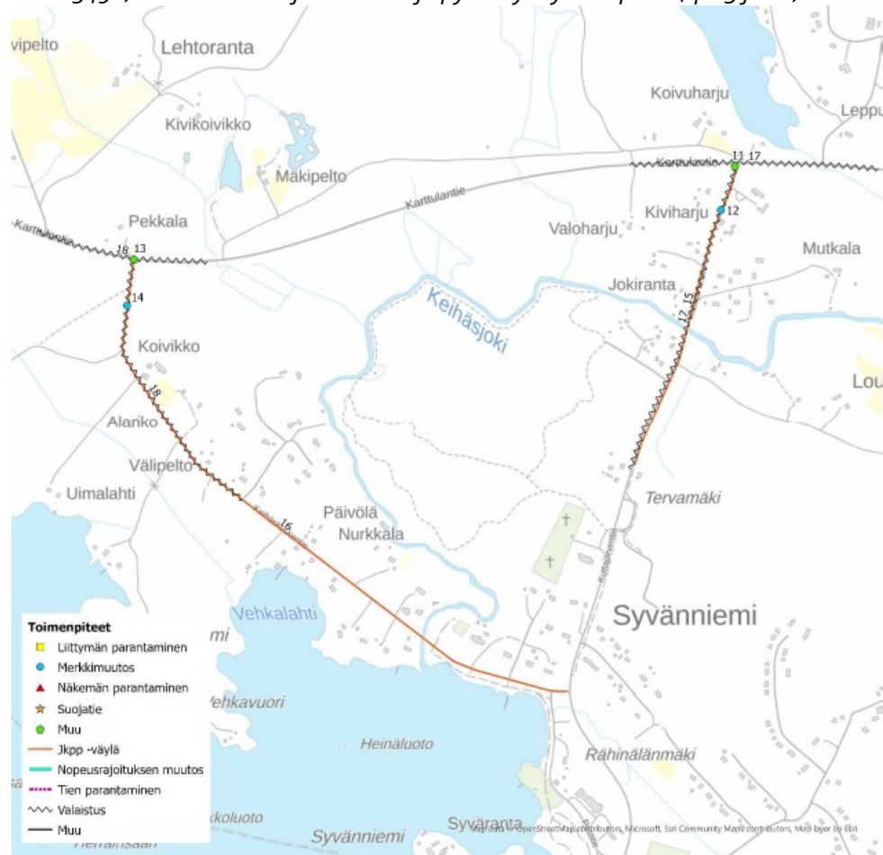
Kuva 14. Syväniemen alueelle esitetyt toimenpiteet.

Syvänniemen alueelle (kuva 14) Toimenpiteiksi esitetään Syväniemeltä Karttulantielle (mt 551) tulevien sekä Kuttajärventien (mt 5514) että Keihäskoskentie (mt 5492) liittymiin liittymä- ja väistämismuutokset merkintöjen parantamista lisäämällä liittymiin väistämismuutosten ennakkomerkit ja väistämiskiivot (tp 11-14). Karttulantielle on esitetty Kuttajärventien ja Ilopurontien liittymien sekä Keihäskoskentie liittymän valaistusta (tp 17 ja 18) sekä valaistuksen jatkamista molemmilla teillä nykyisistä päättymiskohdista Karttulantielle asti. Sekä Kuttajärventiellä (mt 5514) että Keihäskoskentiellä (mt 5492) on tunnistettu jalankulku- ja pyöräilyväylä tarpeita (tp 15 ja 16).